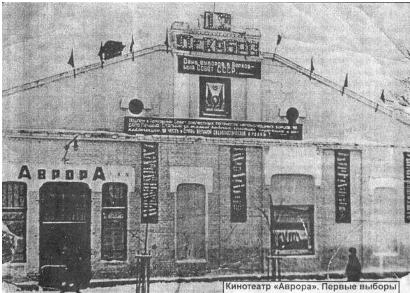
Кинотеатр «Аврора». Первые выборы