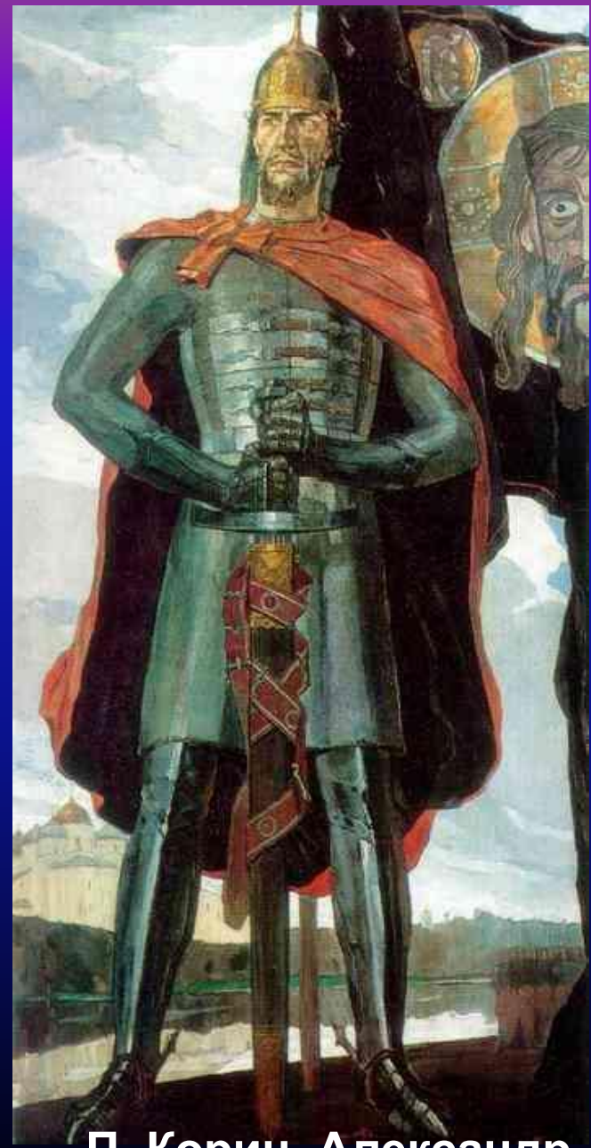
П. Корин. Александр Невский

Всеобщую славу Александру принесла победа, которую он одержал на берегу Невы, в устье реки Ижоры 15 июля 1240 года над шведским отрядом. Согласно легенде отрядом командовал будущий правитель Швеции Ярл Биргер. Александр лично участвовал в битве.