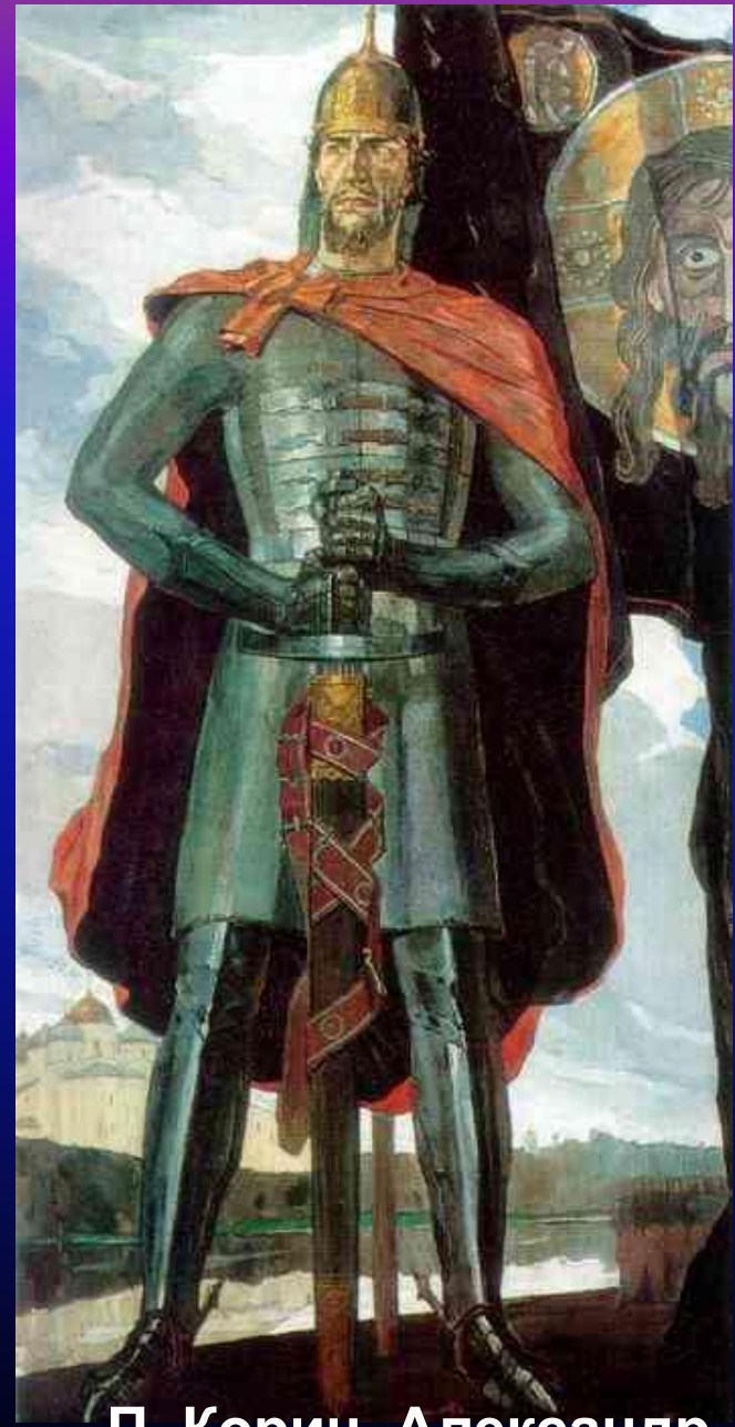
П. Корин. Александр Невский

Всеобщую славу Александру принесла победа, которую он одержал на берегу Невы, в устье реки Ижоры 15 июля 1240 года над шведским отрядом. Согласно легенде отрядом командовал будущий правитель Швеции Ярл Биргер. Александр лично участвовал в битве.