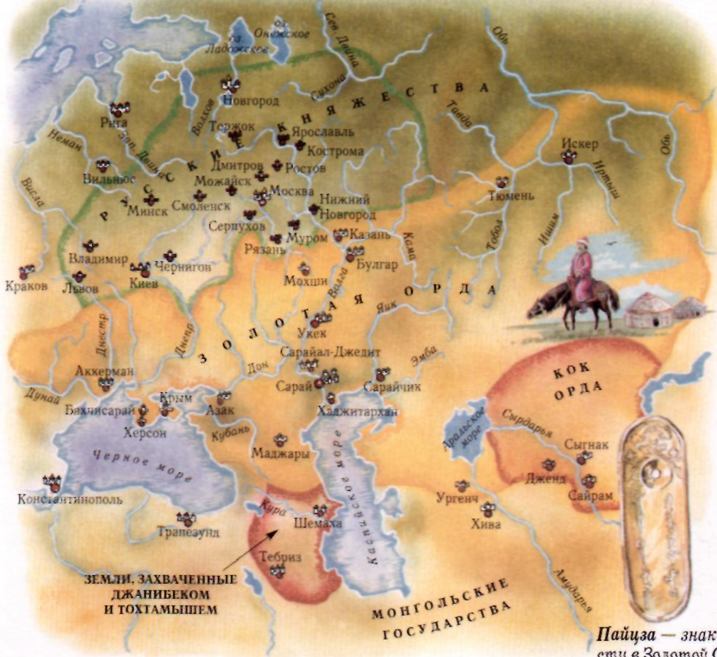
Пайца — знак власти в Золотой Орде