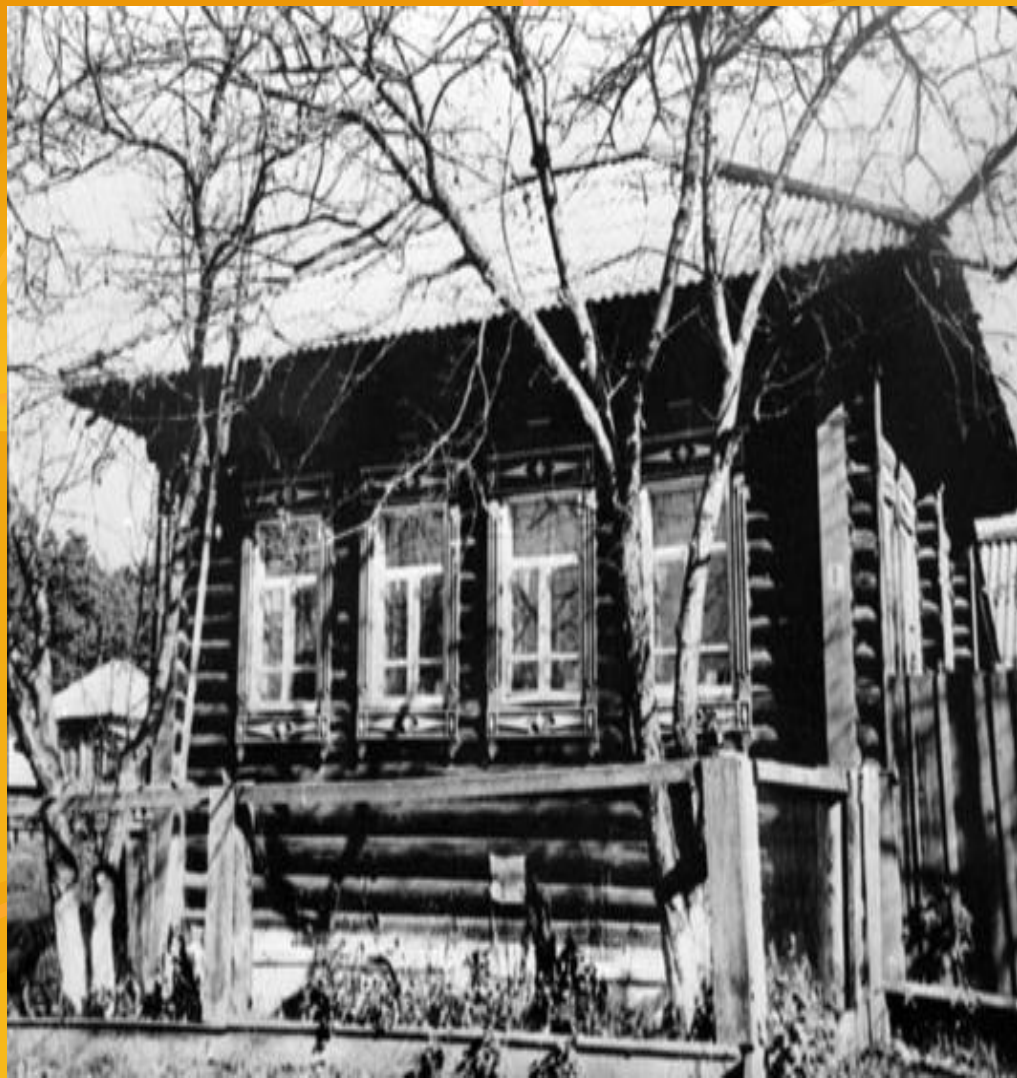
Дом Ельциных в Бутке