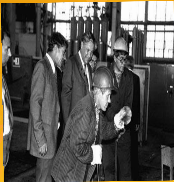
Встреча с трубниками Первоуральска

Профессиональные достижения и организаторский талант привлекли к Б. Н. Ельцину внимание партийных органов. Во второй половине 60-х годов начинается его жизнь в политике. Почти двадцать лет напряженной руководящей работы связывают Б. Н. Ельцина со Свердловском, причем почти 10 из них он стоял во главе областной партийной организации Свердловской области.