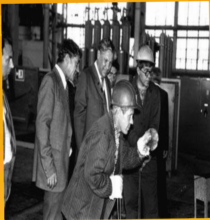
Встреча с трубниками Первоуральска

Профессиональные достижения и организаторский талант привлекли к Б. Н. Ельцину внимание партийных органов. Во второй половине 60-х годов начинается его жизнь в политике. Почти двадцать лет напряженной руководящей работы связывают Б. Н. Ельцина со Свердловском, причем почти 10 из них он стоял во главе областной партийной организации Свердловской области.