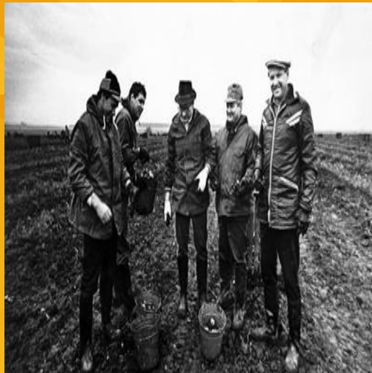
На субботнике по уборке картофеля, 1980 год.