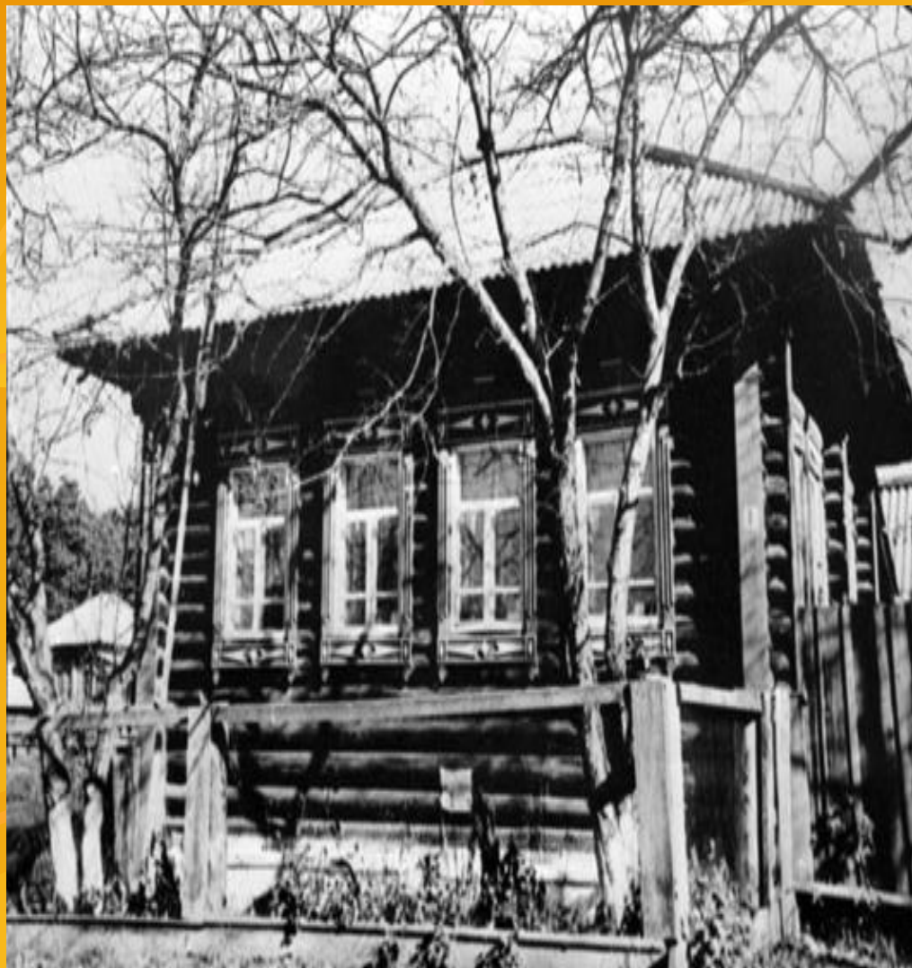
Дом Ельциных в Бутке