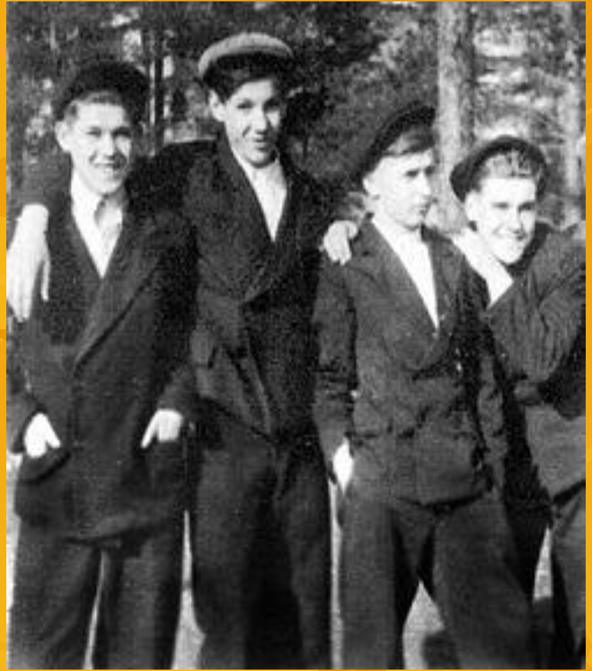
Борис Ельцин (второй слева) с друзьями детства

В школе Ельцин выделялся среди сверстников своей активностью. С первого класса его избирали старостой. Ельцин учился успешно, но отличался дерзким и своенравным поведением, конфликтовал с учителями, за что после седьмого класса был исключен из школы. Вскоре он, однако, был восстановлен и окончил школу с отличными отметками по большинству предметов.