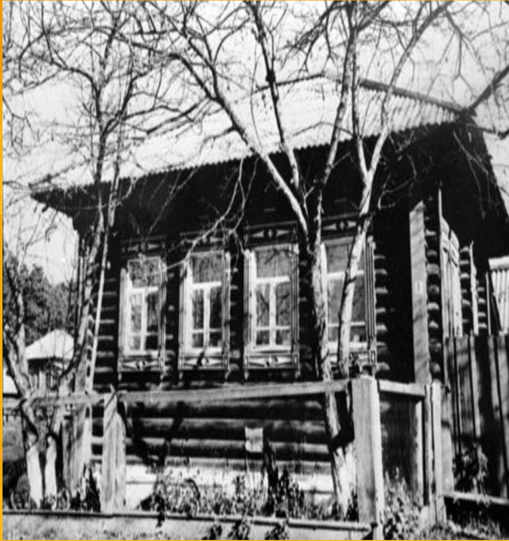
Дом Ельциных в Бутке