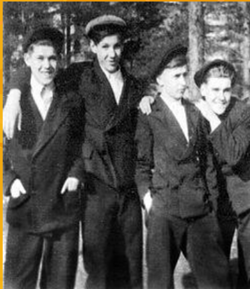
Борис Ельцин (второй слева) с друзьями детства

В школе Ельцин выделялся среди сверстников своей активностью. С первого класса его избирали старостой. Ельцин учился успешно, но отличался дерзким и своенравным поведением, конфликтовал с учителями, за что после седьмого класса был исключен из школы. Вскоре он, однако, был восстановлен и окончил школу с отличными отметками по большинству предметов.