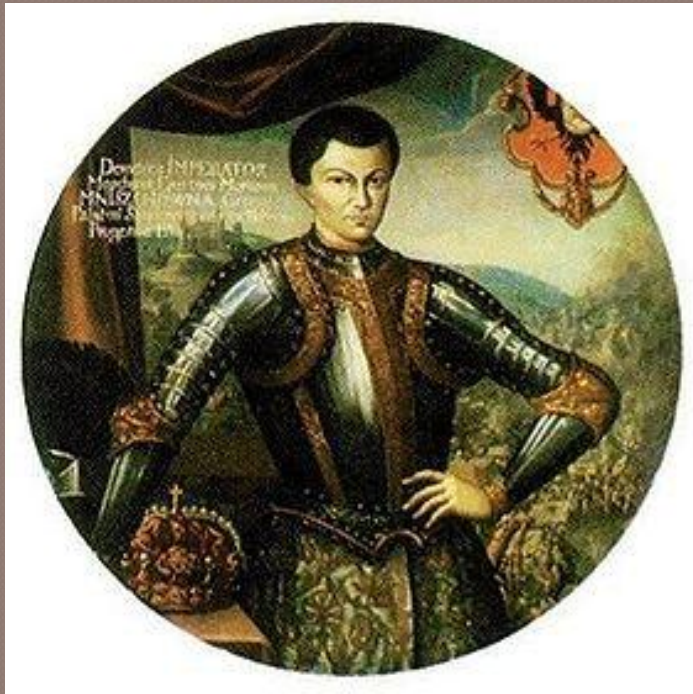
Лжедмитрий I (Дмитрий Иванович)

В 1601г. в Польско-Литовском государстве объявился самозванец, заявивший, что он – «чудом спасшийся» царевич Дмитрий. Это был беглый монах Григорий Отрепьев. Польский король и воевода Мнишек помогли Лжедмитрию собрать войско для похода в Россию.