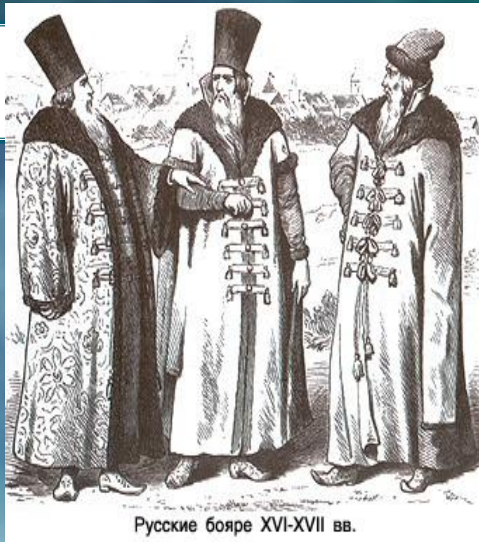
Русские бояре XVI-XVII вв.