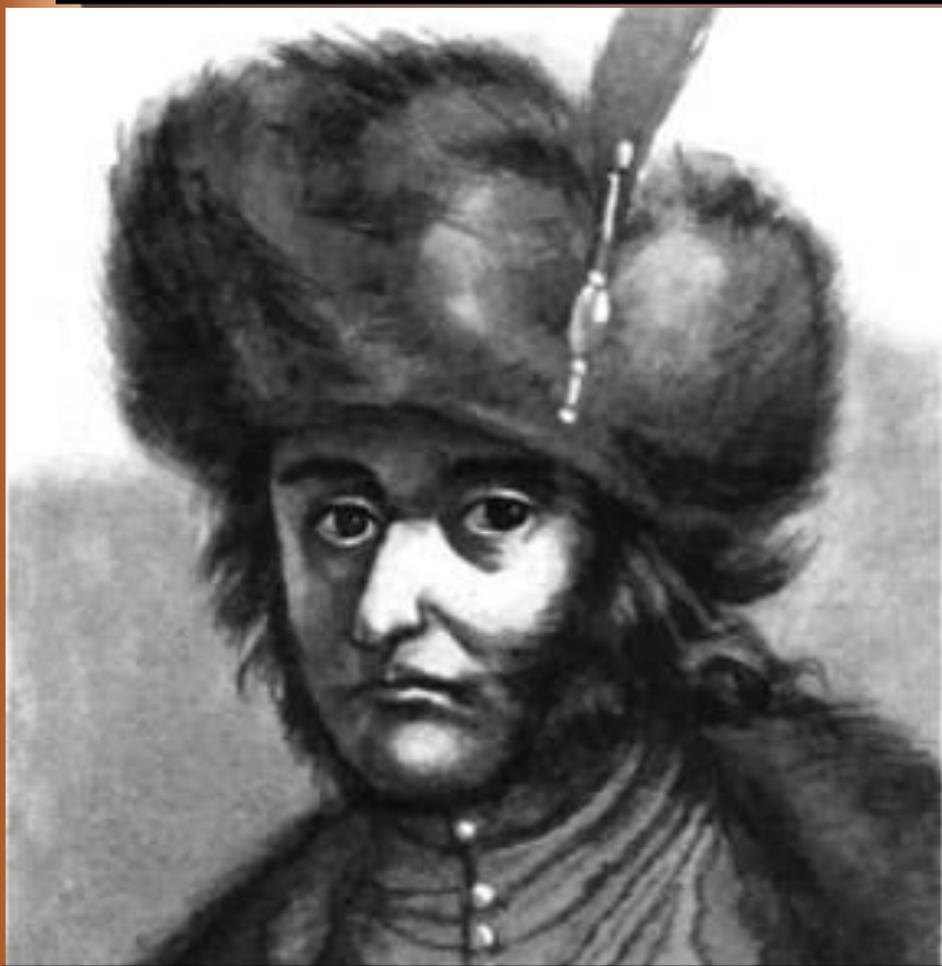
Лжедмитрий I – Григорий Отрепьев

Самозванец на самом деле происходил из мелких дворян, служил у бояр Романовых, а после ссылки постригся в монахи в Чудовом монастыре