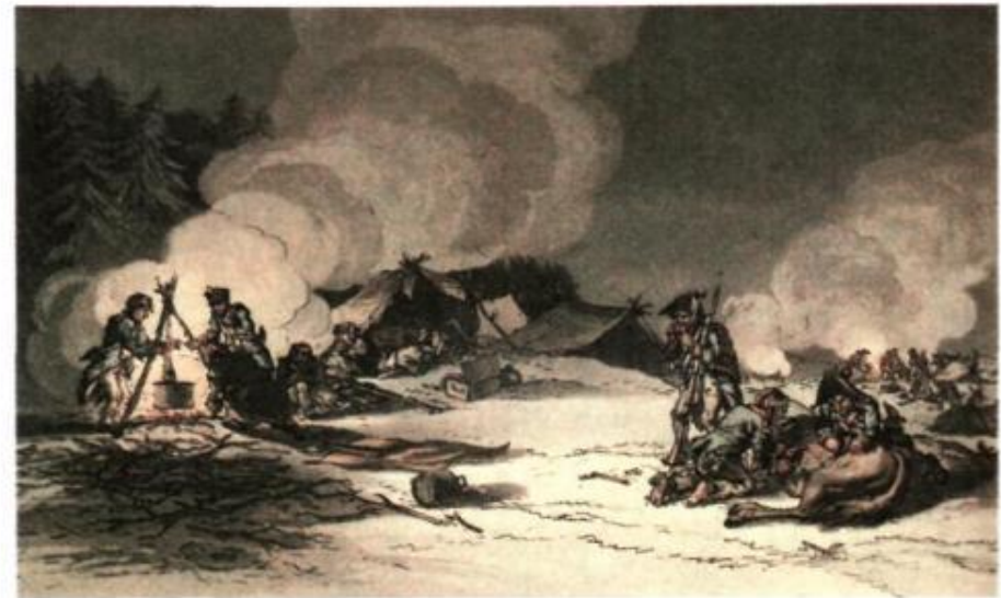
Бегство французской армии из России. 1812 г. Раскрашенная гравюра Х. Манисфельда с оригинала Г. Кленина. Первая четверть XIX в.