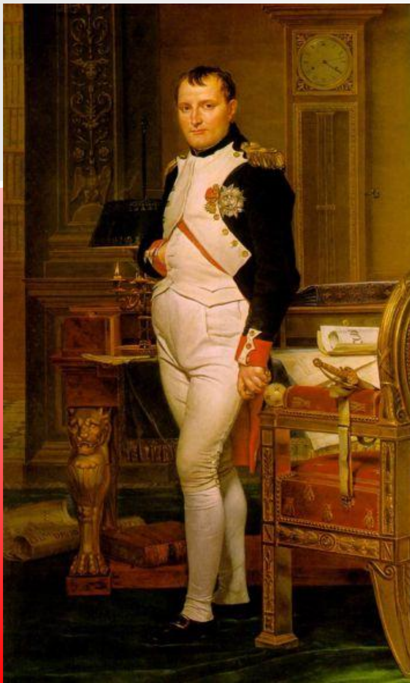
Наполеон – император Франции