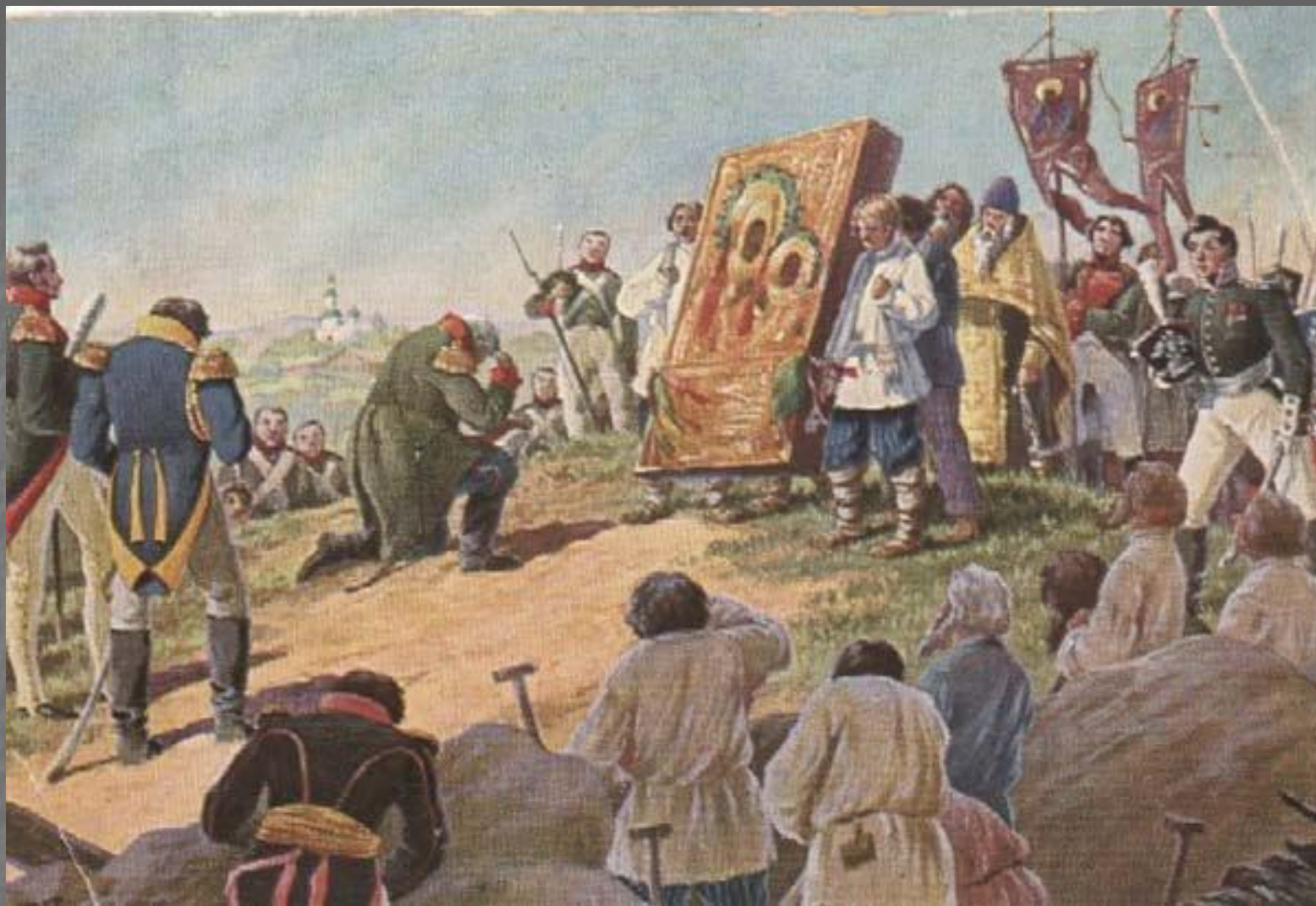
Молебен иконе Божией Матери Смоленской перед Шевардинской битвой