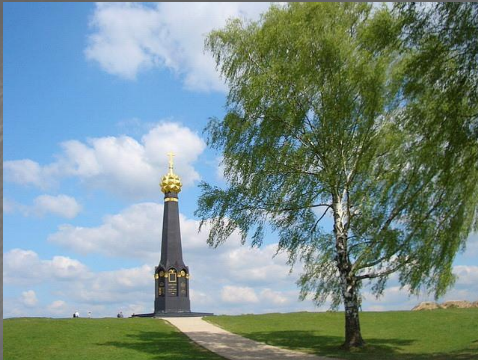
Курганная высота (Батарея Раевского)