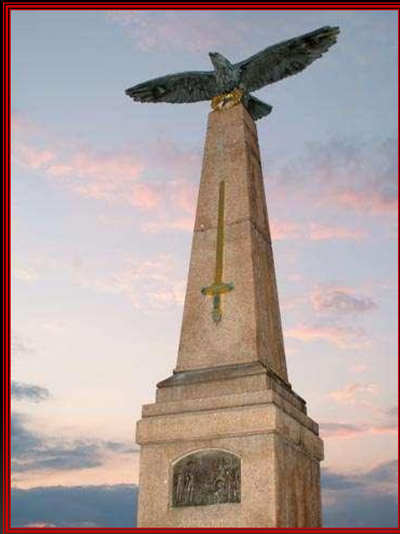
Памятник на командном пункте Кутузова