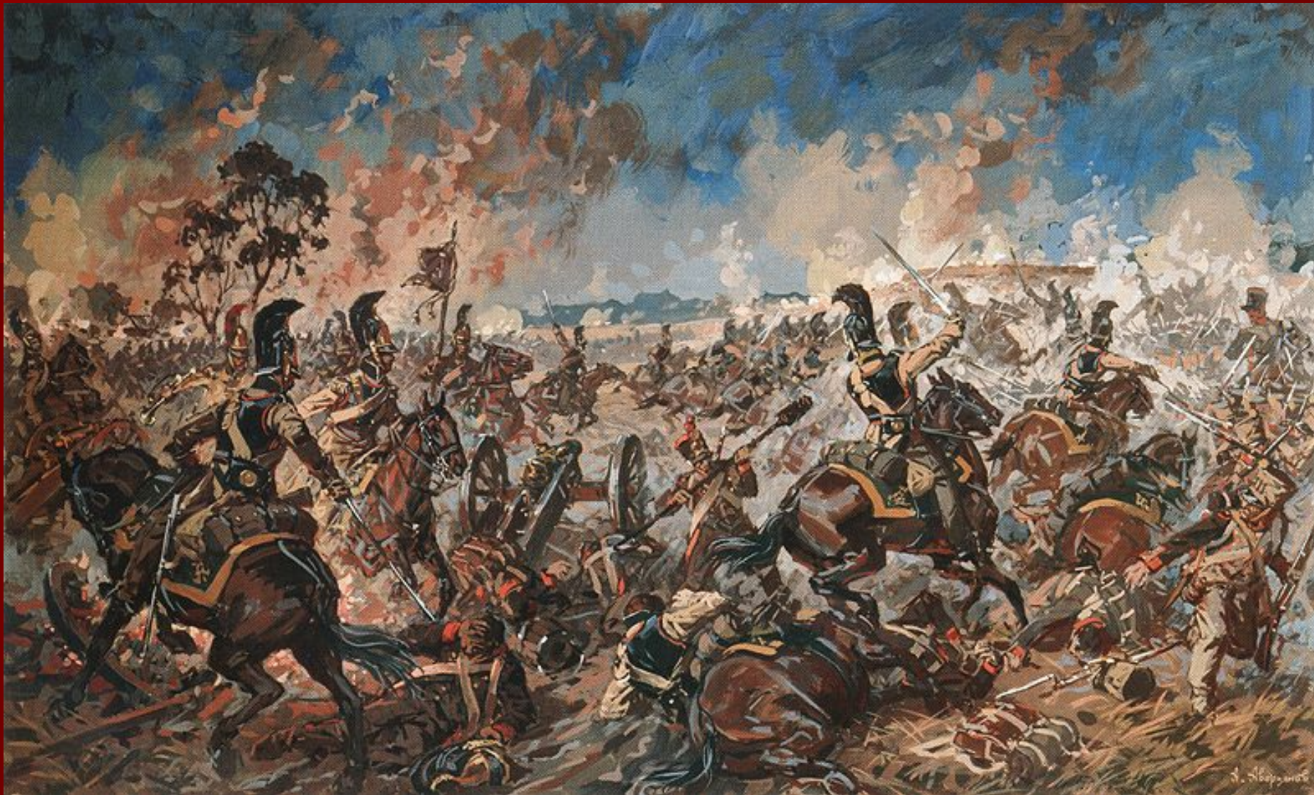
Бой за Шевардинский редут. Художник А.Ю. Аверьянов.