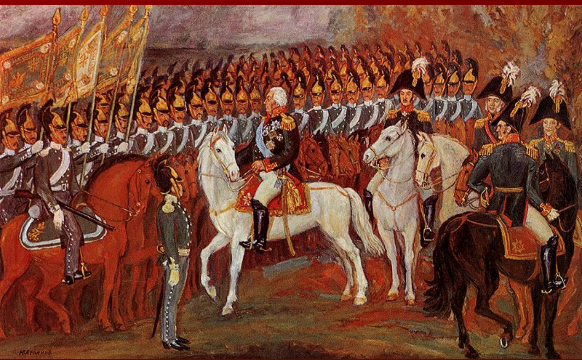
Обращение М. И. Кутузова к войскам накануне Бородинского сражения. Художник Ю. Атланов.