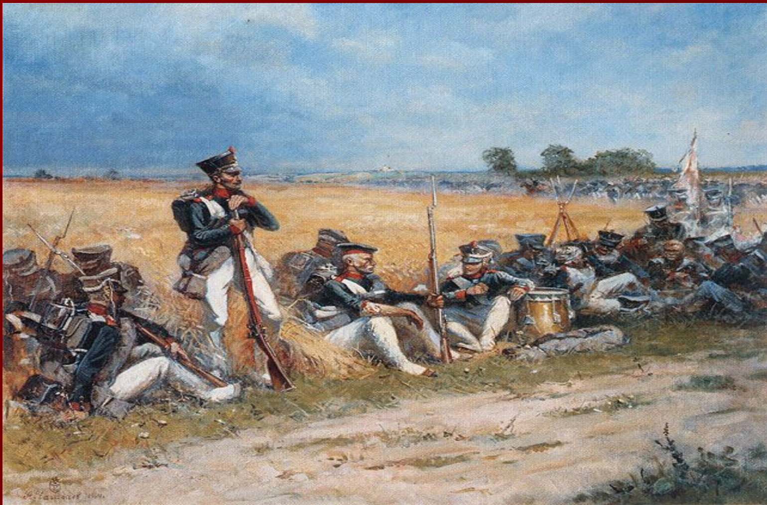
На поле Бородинском. Художник А.С. Чагадаев. 1952 г

И вот нашли большое поле: Есть разгуляться где на воле!