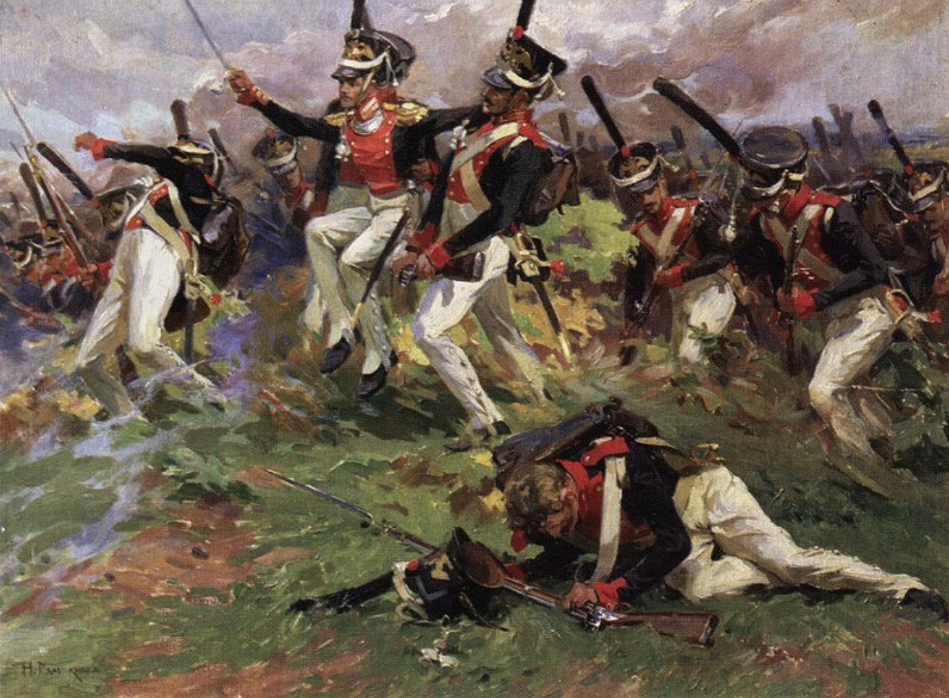
Середина XIX в. Лейб-гвардии Литовский полк в Бородинском сражении Художник Н.С. Самокиш. 1911 г.