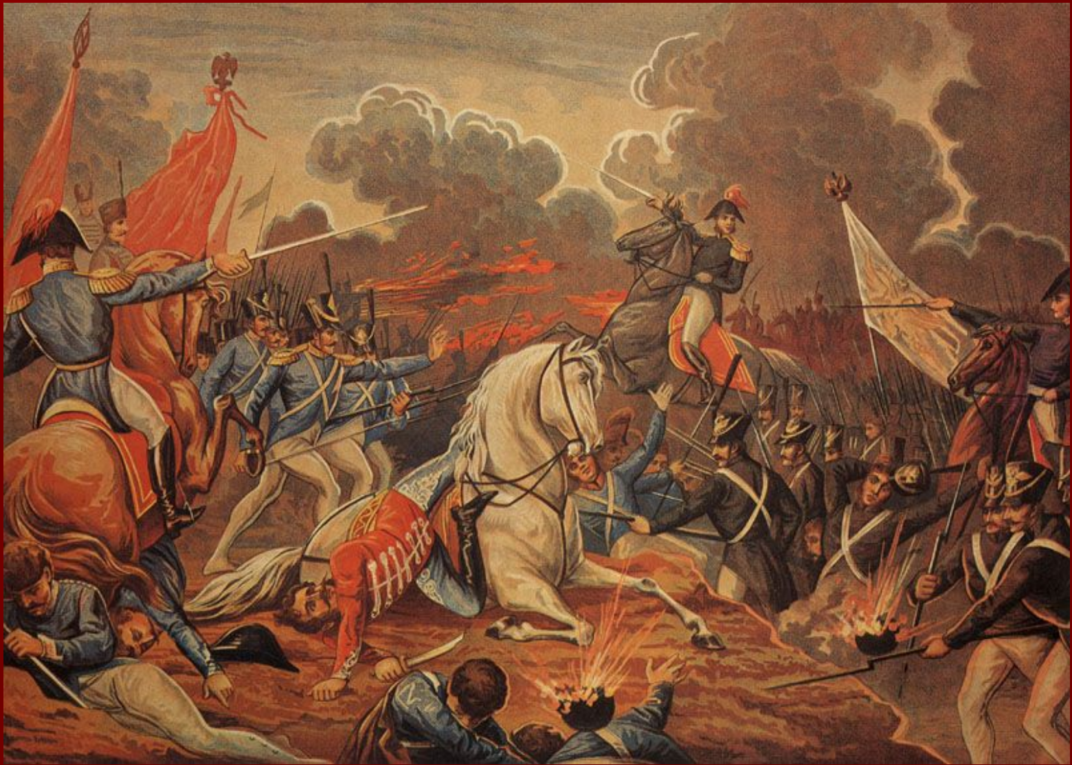
Контратака А. П. Ермолова на батарею Раевского. Хромофотография А. Сафонова.