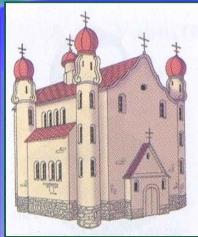
Николаевская церковь в Берестье, где подписана уния

Уния была утверждена на Брестском церковном соборе в 1596 г.