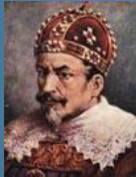
Сигизмунд III Ваза

Многочисленные выступления православных верующих вынудили короля Речи Посполитой вернуть права православной церкви в государстве. Это содействовало распространению униатства на белорусских землях.