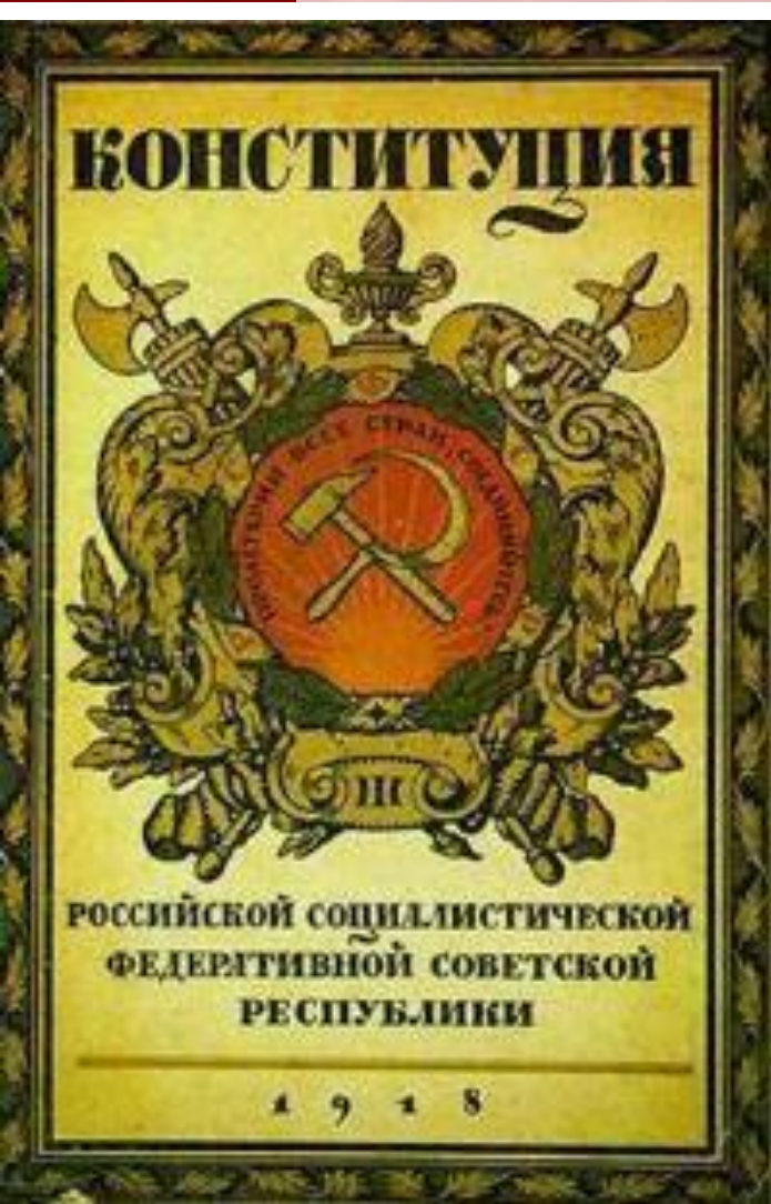
Конституция РСФСР 1918 г.

10 июля 1918 г. V Всероссийский съезд Советов принял Конституцию РСФСР, которая провозглашала Советскую власть в форме диктатуры пролетариата и беднейшего крестьянства. Высшим органом власти становился Съезд Советов, а в промежутках между Съездами - ВЦИК. Исполнительная власть принадлежала Совнаркому.