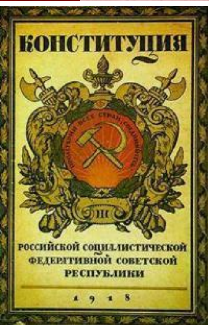
Конституция РСФСР 1918 г.

10 июля 1918 г. V Всероссийский съезд Советов принял Конституцию РСФСР, которая провозглашала Советскую власть в форме диктатуры пролетариата и беднейшего крестьянства. Высшим органом власти становился Съезд Советов, а в промежутках между Съездами - ВЦИК. Исполнительная власть принадлежала Совнаркому.