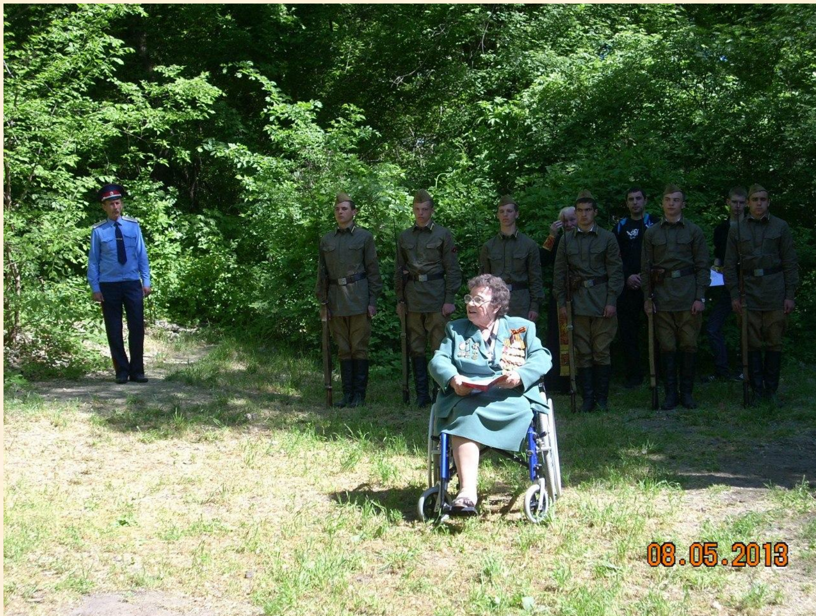
У обелиска 08.05.2013г.