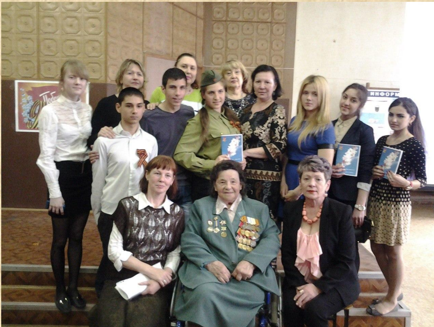
2014-04-29 Литературный конкурс в Ростовском колледже КРИПТ