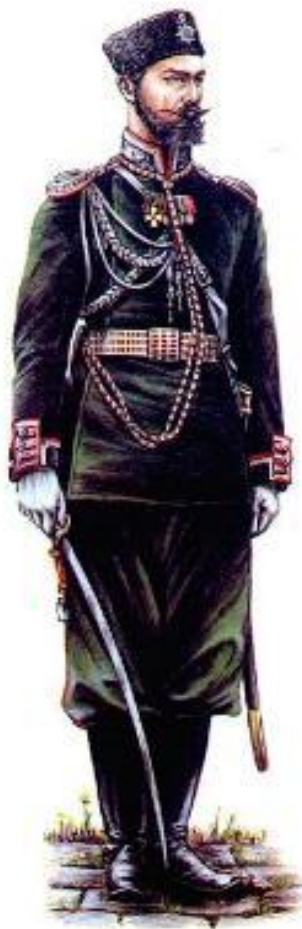
Офицер Генерального штаба.

В армии отменялись телесные наказания, улучшался быт и обучение солдат.