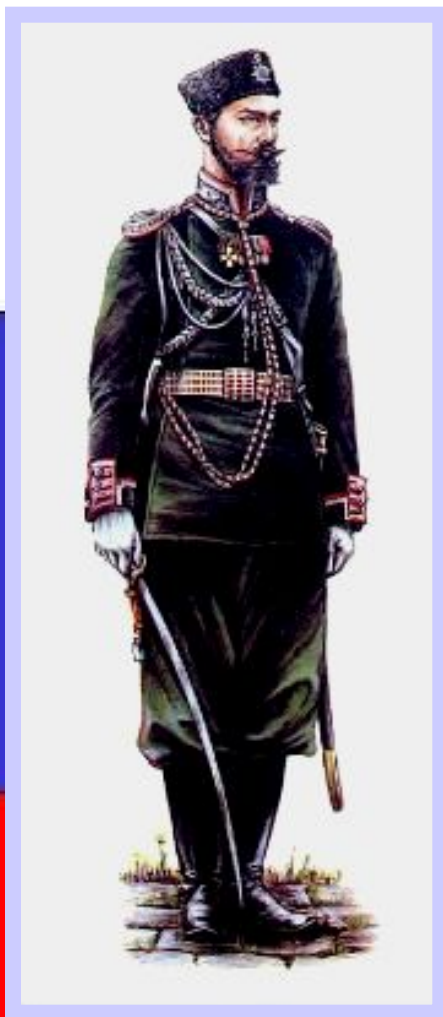
Офицер Генерального штаба.

В армии отменялись телесные наказания, улучшался быт и обучение солдат.