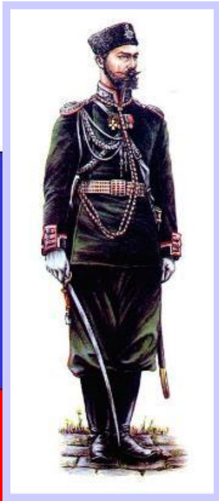
Офицер Генерального штаба.

В армии отменялись телесные наказания, улучшался быт и обучение солдат.