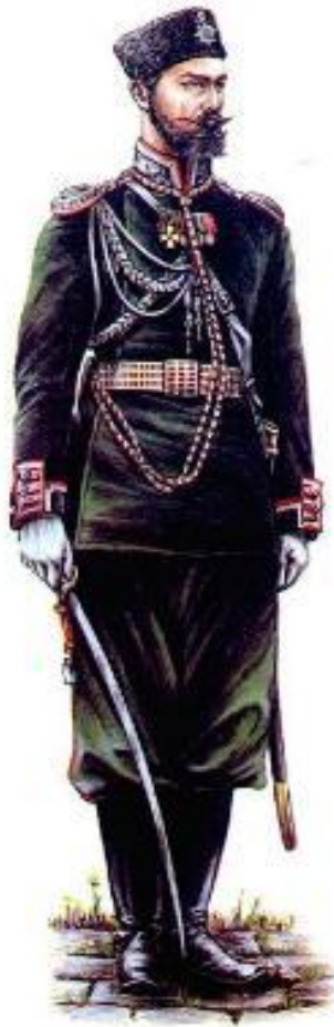
Офицер Генерального штаба.

В армии отменялись телесные наказания, улучшался быт и обучение солдат.