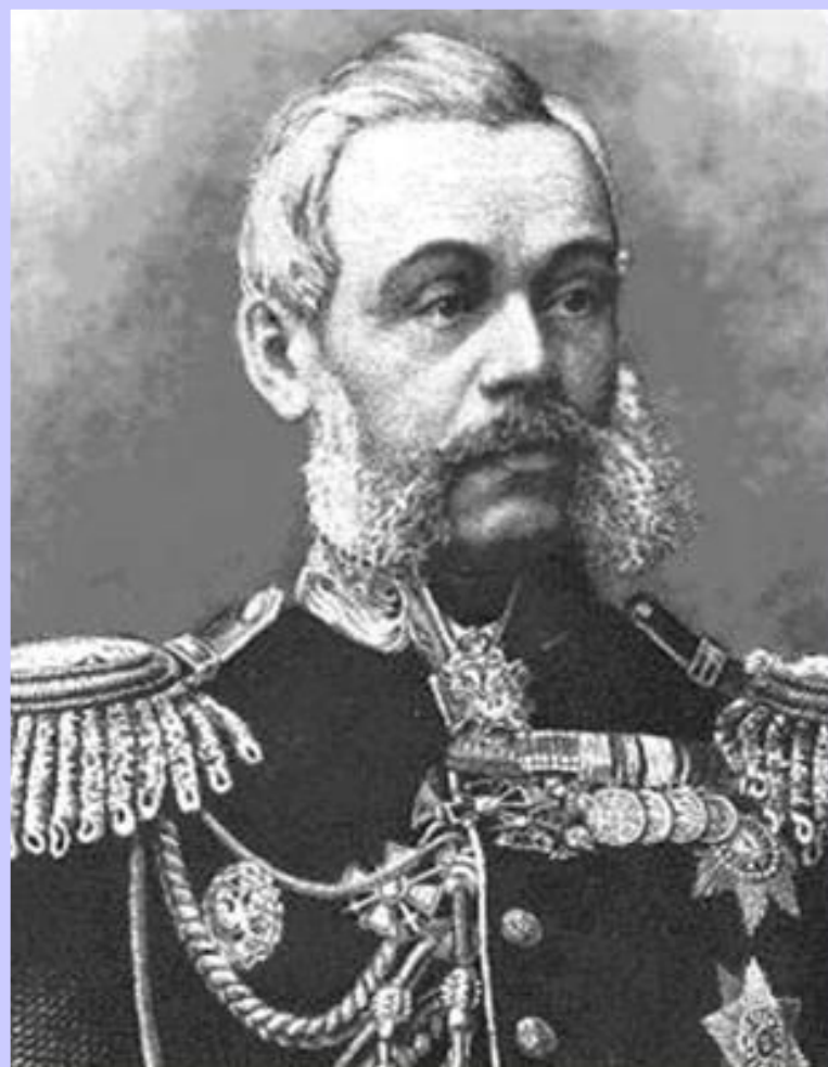
Военный министр Д.А.Милютин

В 1874 г. была проведена военная реформа по инициативе Д.А.Милютин.