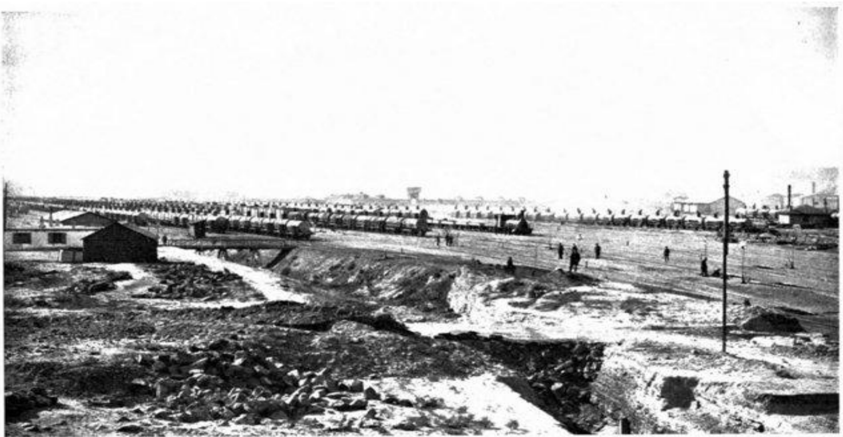
FIG. 84.—TANK CARS ON RAILWAY SIDINGS NEAR BLACK TOWN, BAKU.