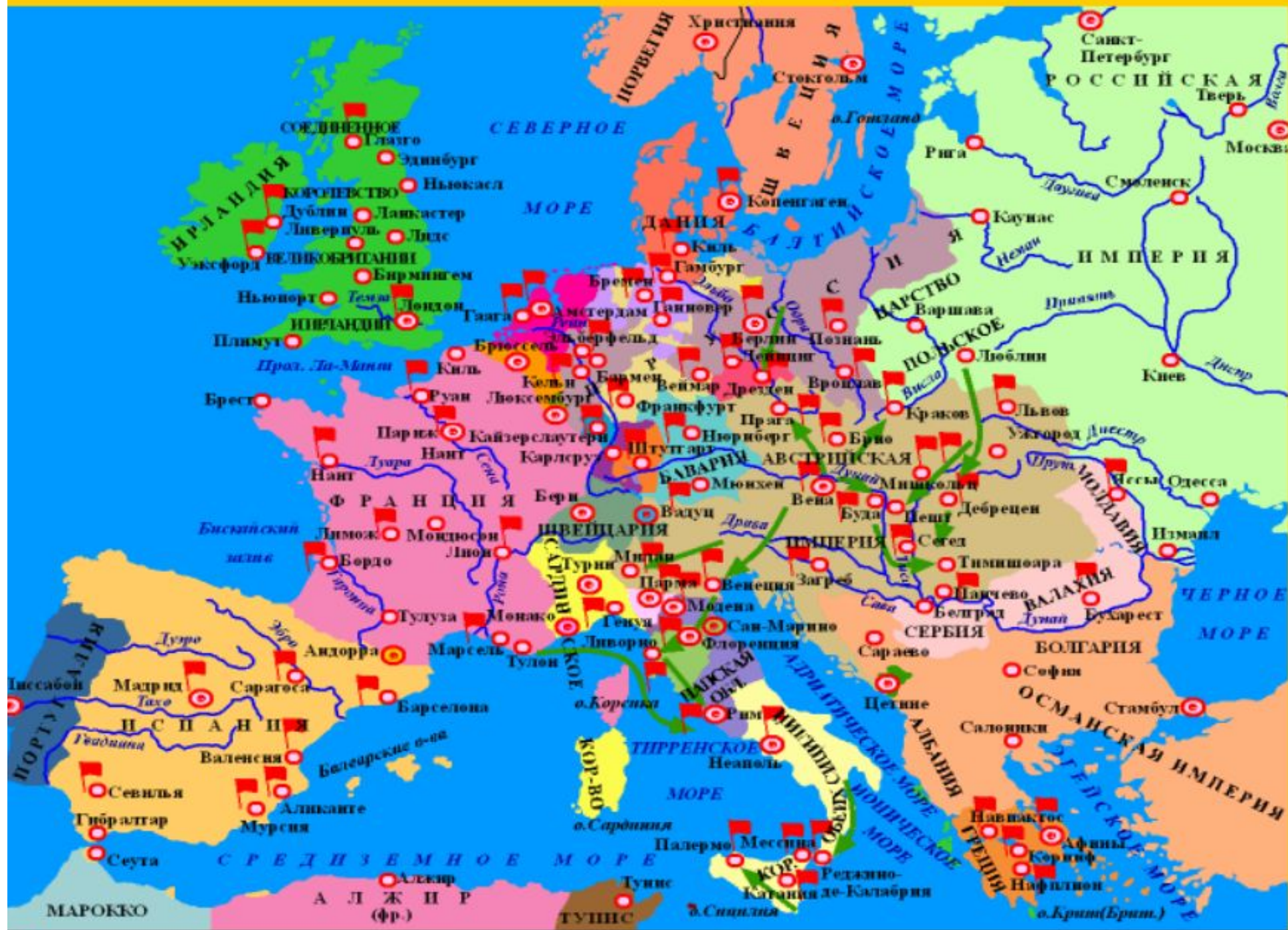
■ Места крупных революционных выступлений в 1848-49 гг. ➔ Действия войск внутренней и внешней контрреволюции