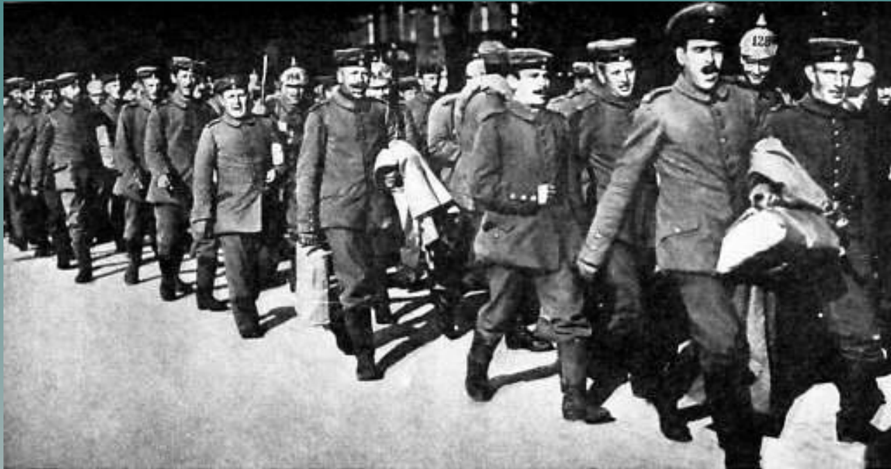
Германские солдаты поют, маршируя на войну