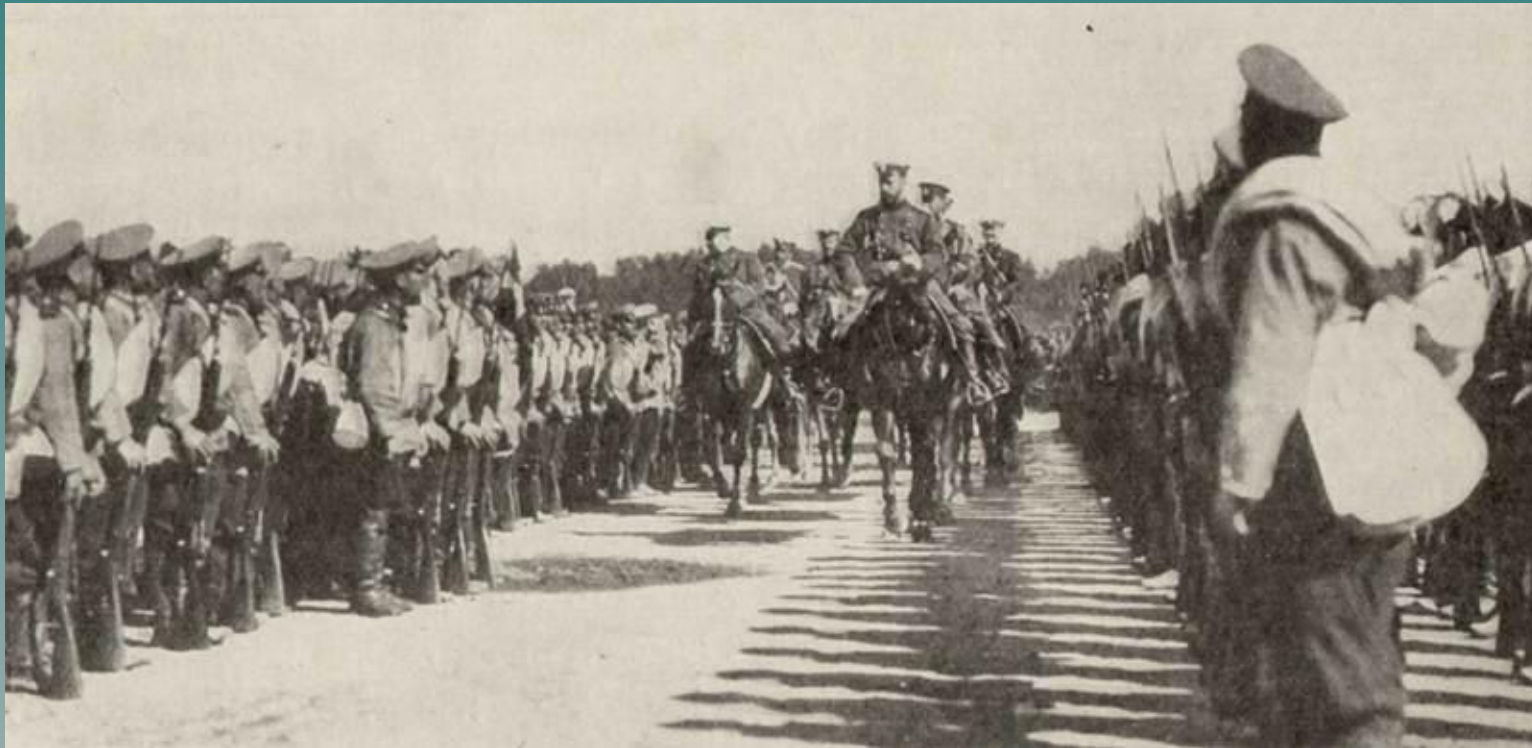
Царь Николай II на смотре войск