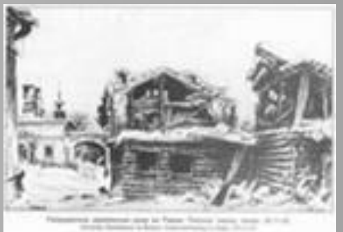
Улицы в Ленинграде. Видны здания Боткинской больницы, Троицкого собора