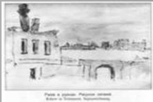
Улицы в Ленинграде. Видны здания Боткинской больницы, Троицкого собора