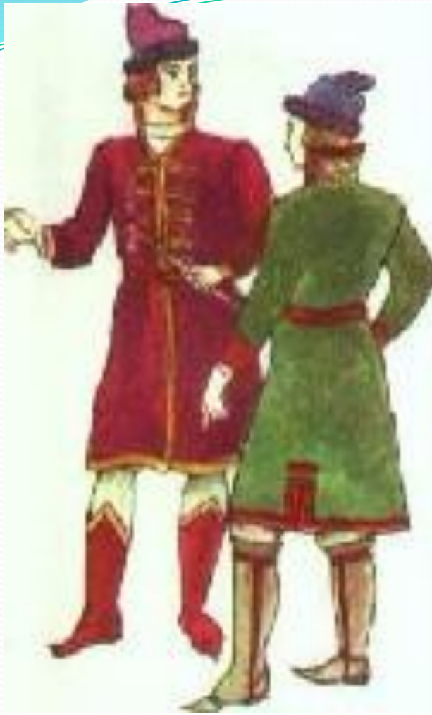
Кафтан с воротником-козырем.