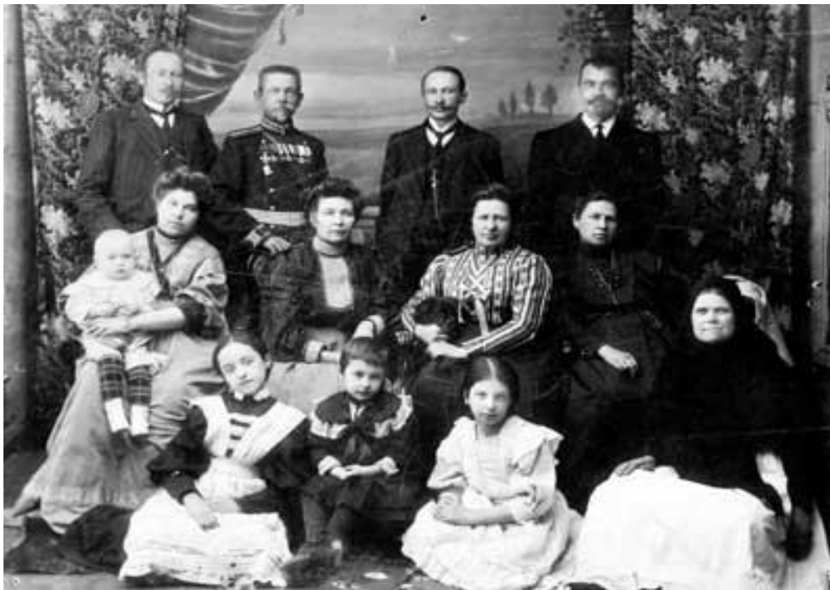
Семья купца Унженина

Основная масса купечества по-прежнему соблюдала традиционные уклад жизни. В домах сохранялась строгая субординация по «Домострою». Жила обычная купеческая семья общим хозяйством, закупая материал на одежду «штуками», на всех. Касса предприятия или заведения долгое время также была общей.