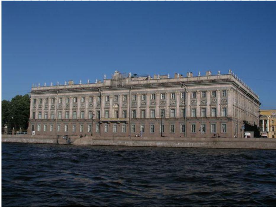
Мраморный дворец, построенный для Г.Г. Орлова

Императоры приказывали строить дворцы и для своих фаворитов. По приказу Екатерины II Мраморный дворец был построен для Г. Орлова