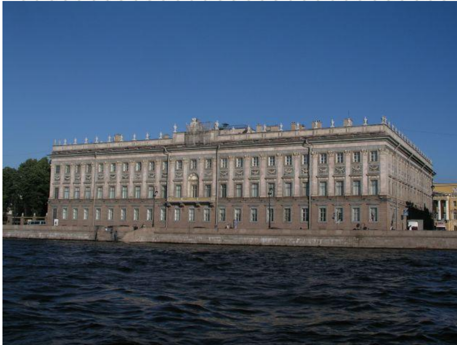
Мраморный дворец, построенный для Г.Г. Орлова

Императоры приказывали строить дворцы и для своих фаворитов. По приказу Екатерины II Мраморный дворец был построен для Г. Орлова