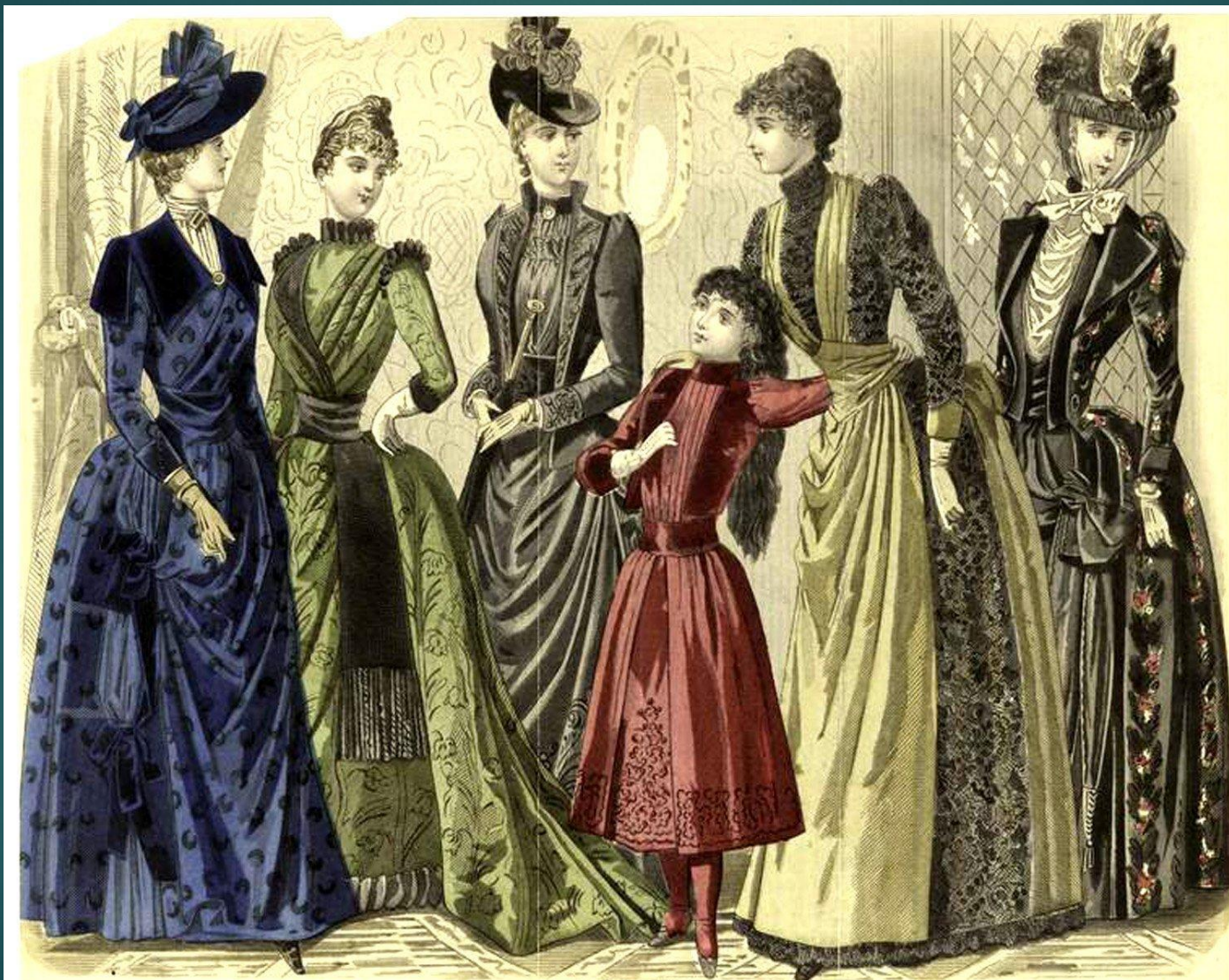
LES MODES PARISIENNES. PETERSON'S MAGAZINE. SEPTEMBER, 1889. EARLY AUTUMN RECEPTION