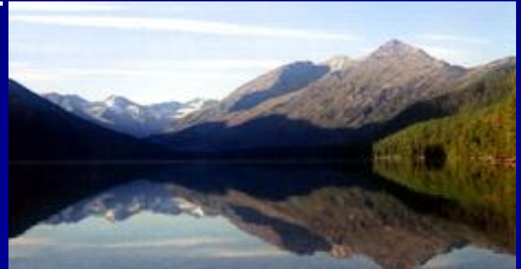
Мультинское озеро. Катунский хребет.