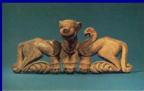
Деревянное украшение конской сбруи