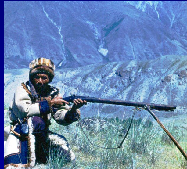
Алтаец с древним ружьем