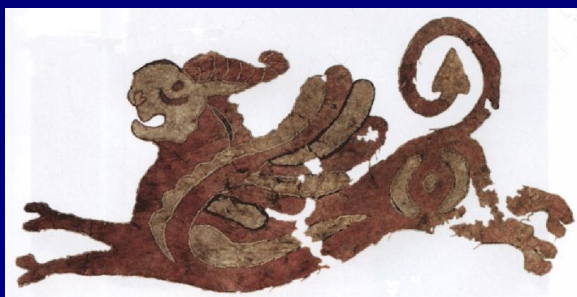
Грифон- войлочная аппликация