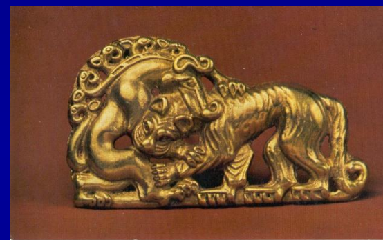
Золотая бляшка- сцена терзания