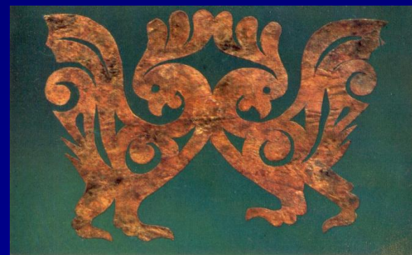
Украшение деревянного саркофага- кожа