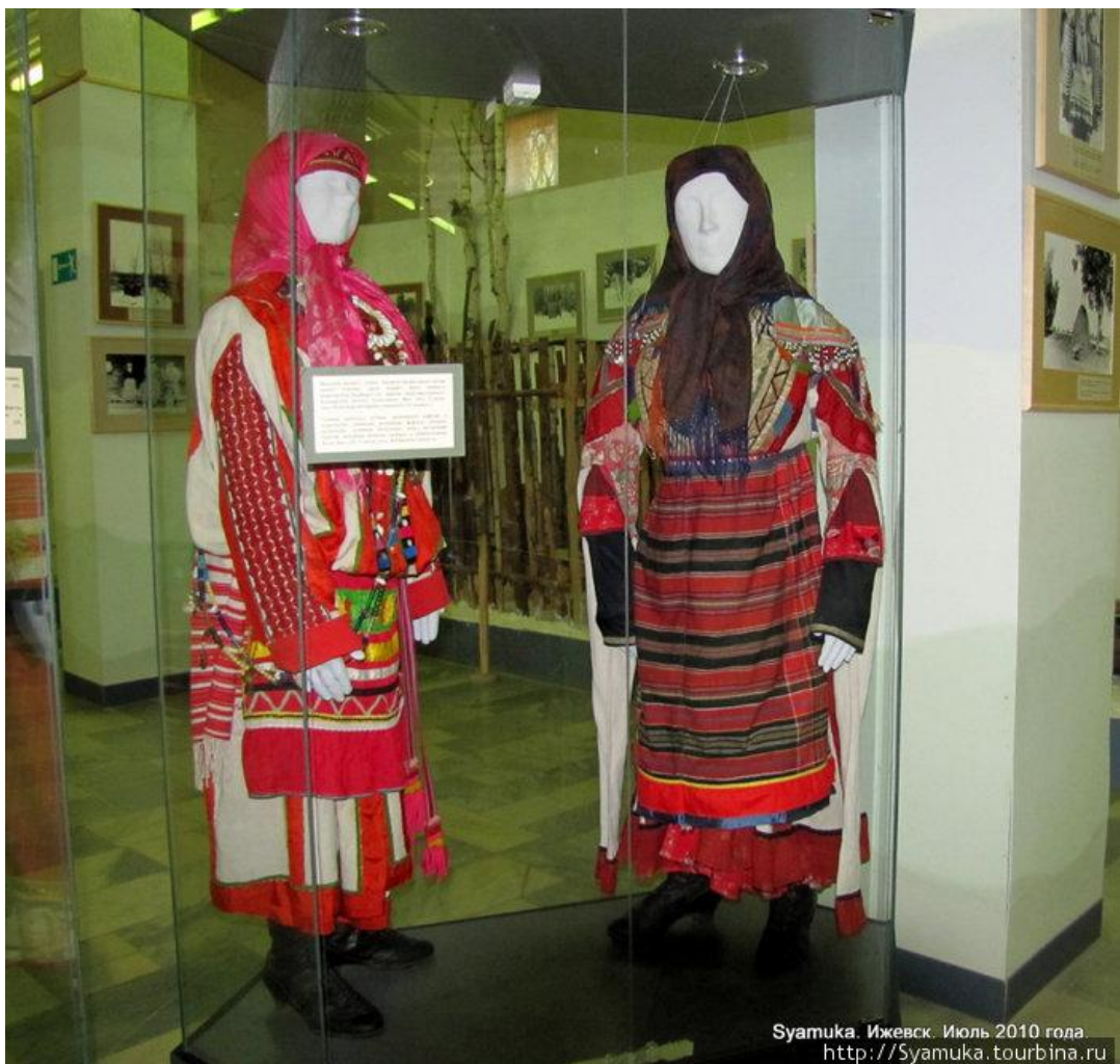
Сямука. Ижевск. Июль 2010 года. http://Syamuka.tourbina.ru