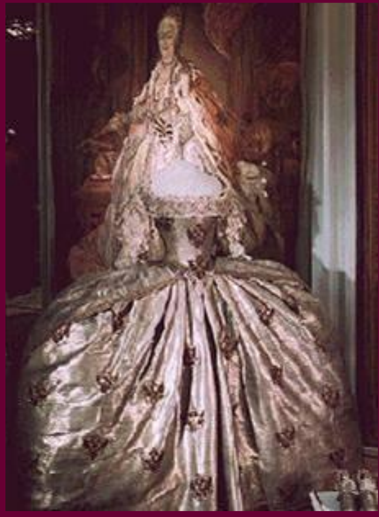
Платье императрицы Елизаветы Петровны.

В 18 в. среди дворян постепенно распространилась одежда европейского покроя, которую начинают шить непосредственно в России. Модные магазины открывались иностранцами оседавшими в стране.