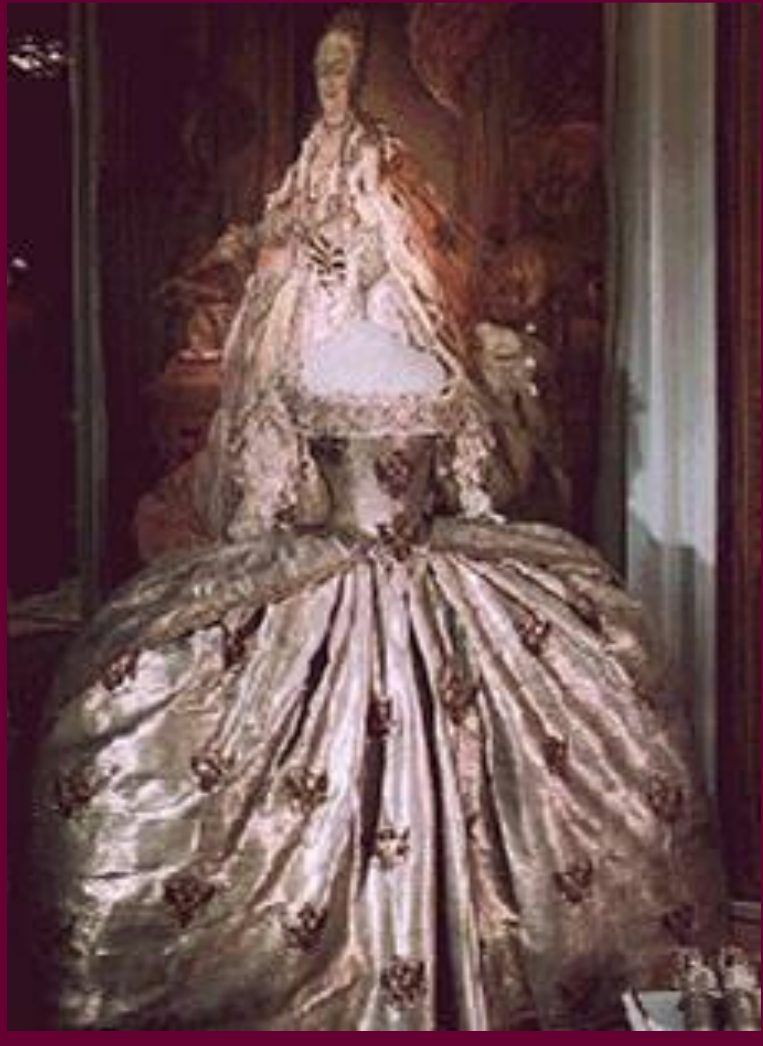
Платье императрицы Елизаветы Петровны.

В 18 в. среди дворян постепенно распространилась одежда европейского покроя, которую начинают шить непосредственно в России. Модные магазины открывались иностранцами оседавшими в стране.