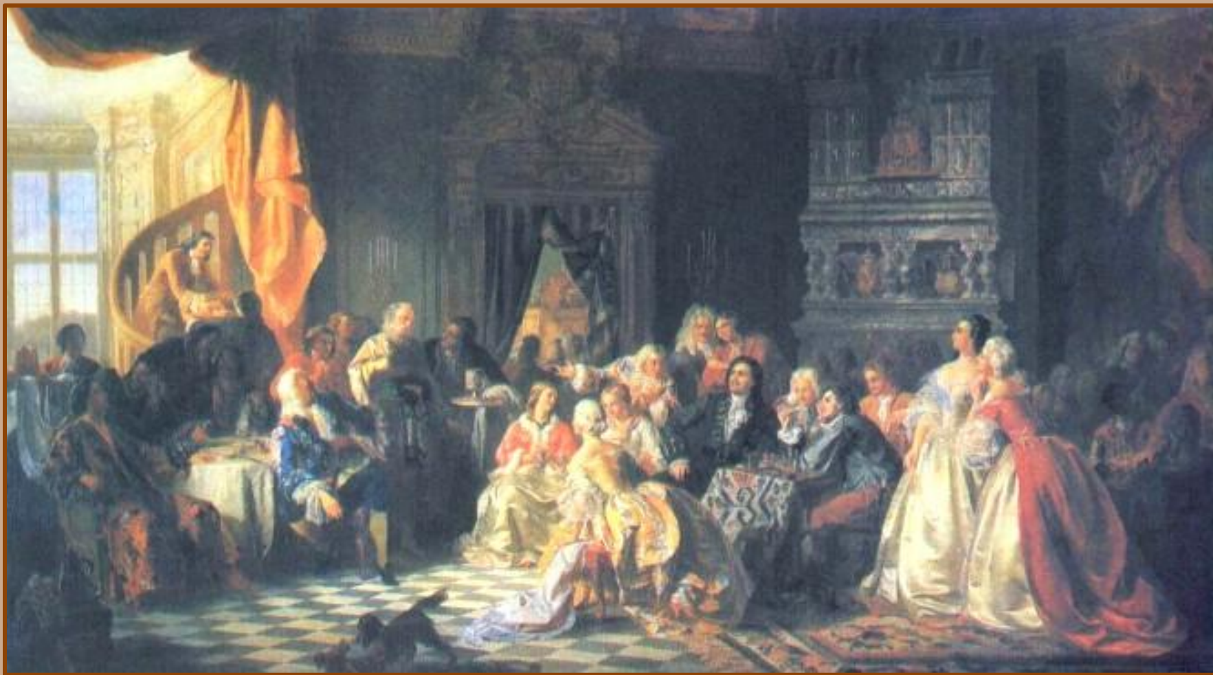
Ассамблея при петре I

В начале XVIII века с реформами петра I в Россию начала проникать и Заграничная мода. Постепенно стали меняться облик, одежда, интересы И нравы русских людей.