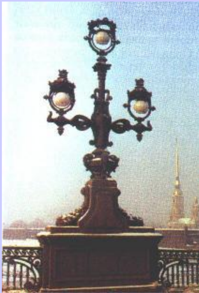
Фонарь на Троицком мосту в Петербурге.

В городах быстро строились новые здания: вокзалы, рынки, театры, банки и др. Большинство из них были многоэтажными в 5-6 этажей.