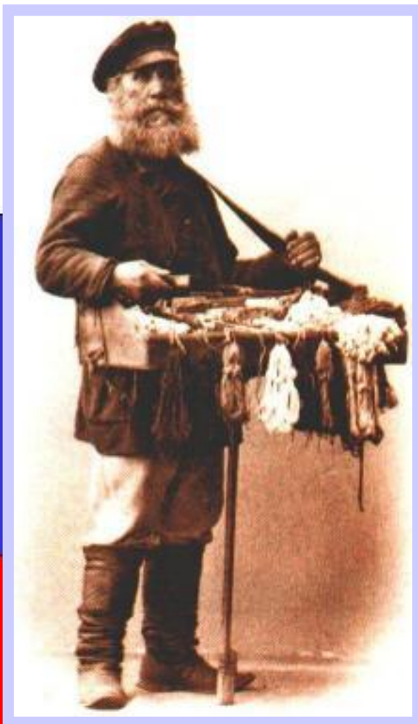
Торговец галантерейными товарами

Рабочие районы жили своей жизнью. Одежда рабочих походила на крестьянскую. Рабочие жили на харчах у хозяина. За приемом пищи следил староста. В этих районах было много торговцев с дешевыми товарами. На праздники они приносили лакомства.