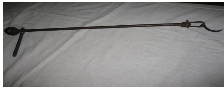
Безмен – весы.

На Руси для глажения белья использовали «утюг» - рубель, а позже литые чугунные утюги.