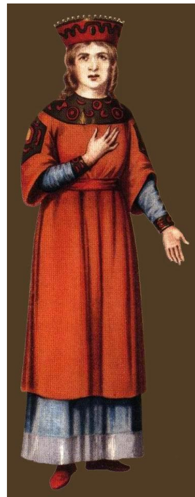
ОДЕЖДА РУССКОЙ ЗНАТИ