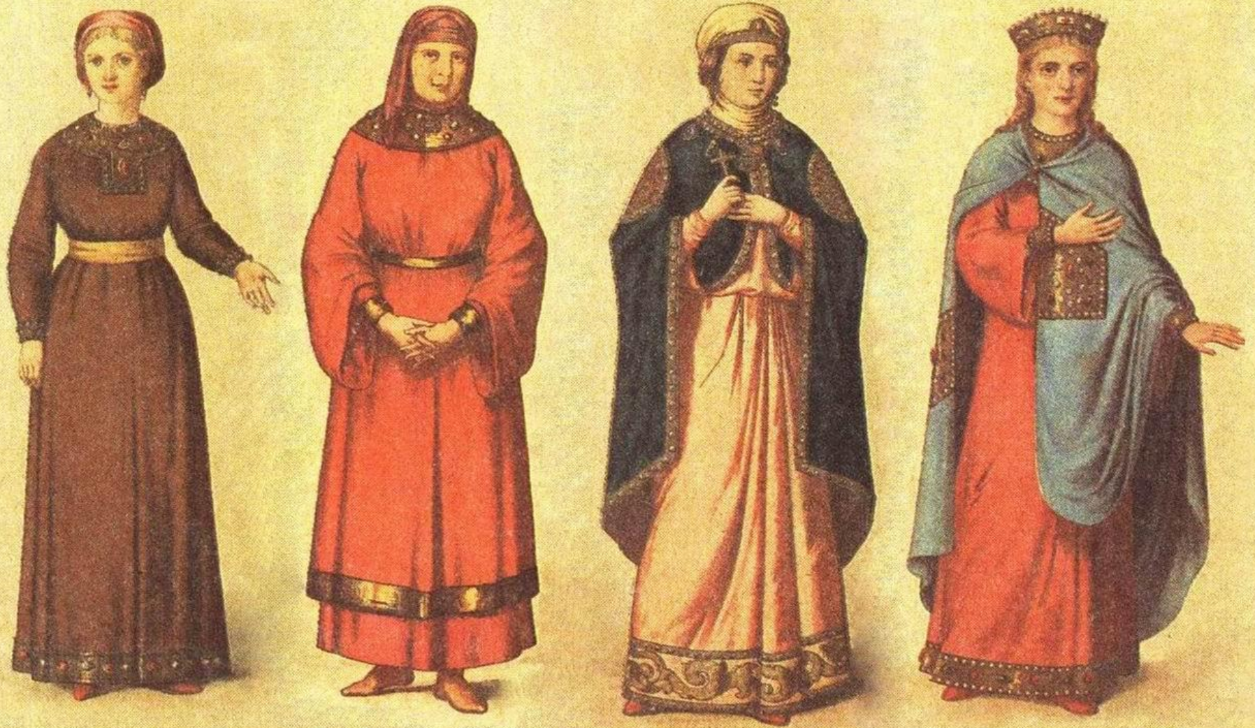
ОДЕЖДА ЗНАТНЫХ ЖЕНЩИН