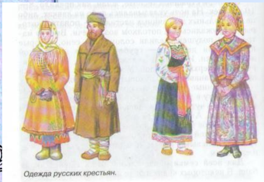
Одежда русских крестьян.