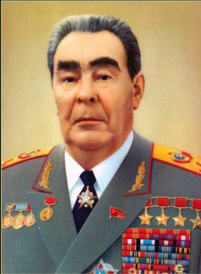
Генеральный секретарь ЦК КПСС.