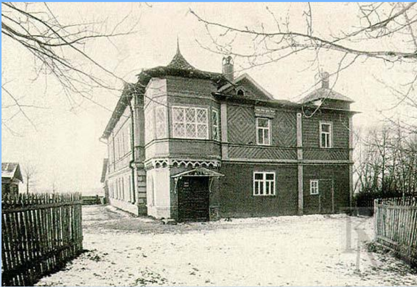
Дом П. И. Чайковского в Клину. 1893 год.

В 1892 году обосновался в Клину, под Москвой