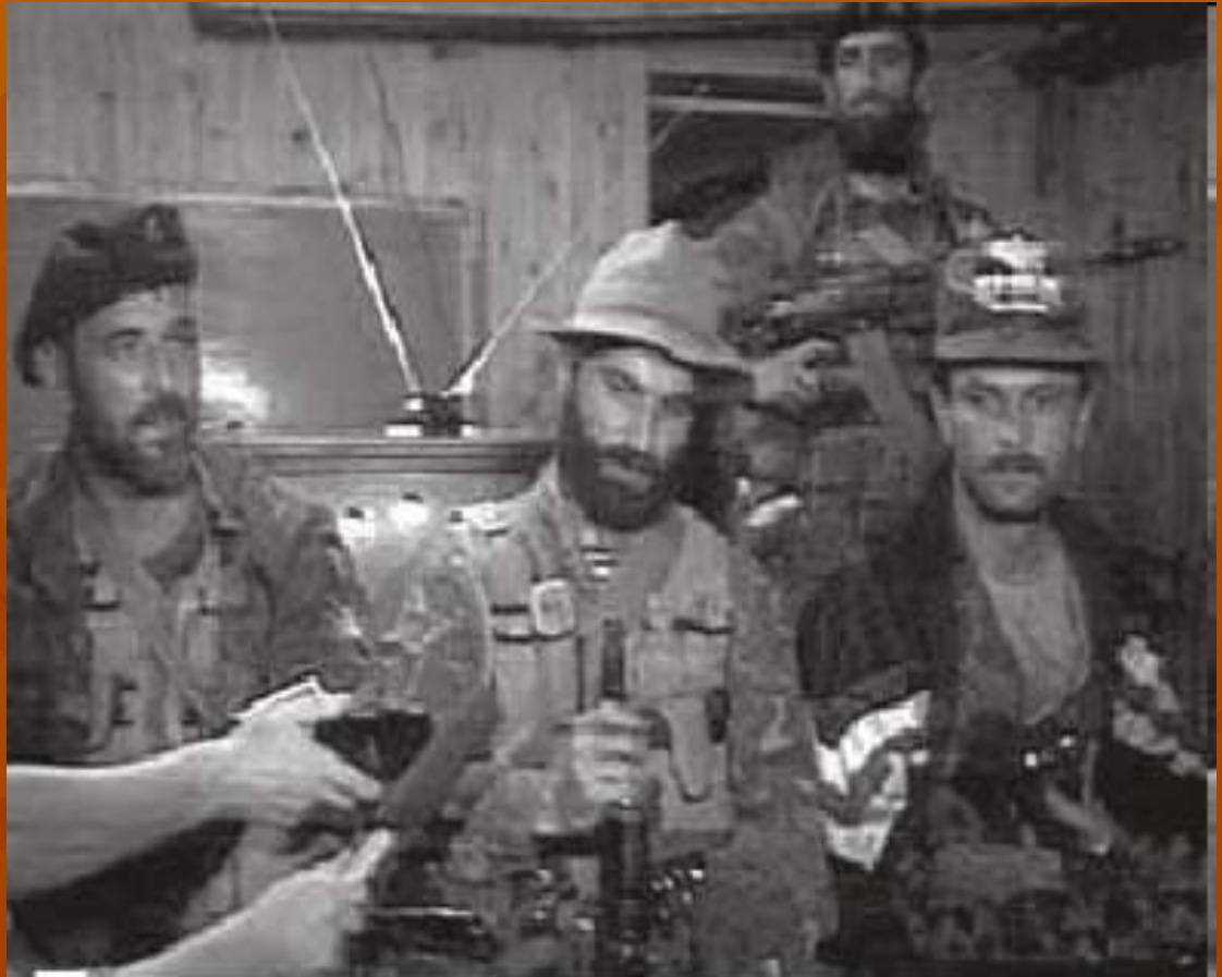
Террористы во время переговоров. В центре - командир отряда Шамиль Басаев. 15 июня 1995 г. г. Буденновск.

■ Война сопровождалась акциями взятия заложников. 14 июня 14 июня 1995 года группа чеченских боевиков численностью 195 человек во главе с полевым командиром Шамилем Басаевым 14 июня 1995 года группа чеченских боевиков численностью 195 человек во главе с полевым командиром Шамилем Басаевым на грузовиках въехала на территорию Ставропольского края 14