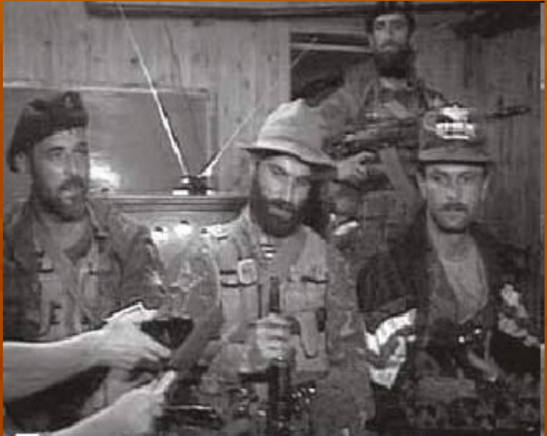
Террористы во время переговоров. В центре - командир отряда Шамиль Басаев. 15 июня 1995 г. г. Буденновск.

■ Война сопровождалась акциями взятия заложников. 14 июня 14 июня 1995 года группа чеченских боевиков численностью 195 человек во главе с полевым командиром Шамилем Басаевым 14 июня 1995 года группа чеченских боевиков численностью 195 человек во главе с полевым командиром Шамилем Басаевым на грузовиках въехала на территорию Ставропольского края 14