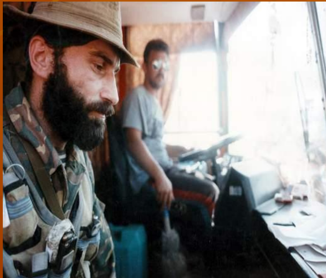
Шамиль Басаев Шамиль Басаев в автобусе с заложниками

Общие потери российской стороны, по официальным данным, составили 143 человека (из которых 46 являлись сотрудниками силовых структур) и 415 раненных, потери террористов — 19 убитыми и 20 ранеными.