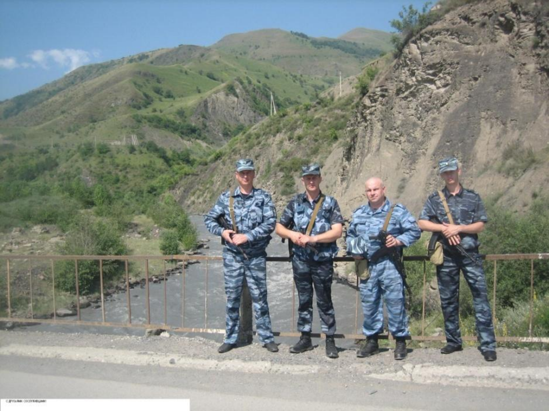
С ДРУЖИМ СОСЛУЖИЦАМИ