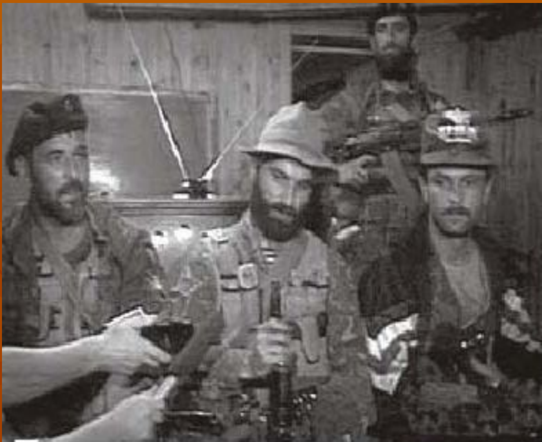
Террористы во время переговоров. В центре - командир отряда Шамиль Басаев. 15 июня 1995 г. г. Буденновск.

■ Война сопровождалась акциями взятия заложников. 14 июня 14 июня 1995 года группа чеченских боевиков численностью 195 человек во главе с полевым командиром Шамилем Басаевым 14 июня 1995 года группа чеченских боевиков численностью 195 человек во главе с полевым командиром Шамилем Басаевым на грузовиках въехала на территорию