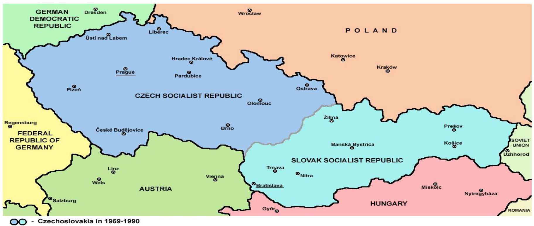
Чехословацкая социалистическая республика 1969–1989

Последующие двадцать лет, когда страной руководил Густав Гусак, были ознаменованы политикой «нормализации» (политического застоя при экономическом стимулировании). В 1989 коммунисты лишились власти в результате бархатной революции, а страну возглавил писатель-диссидент Вацлав Гавел с 31.12.1989 — последний президент Чехословакии и первый президент