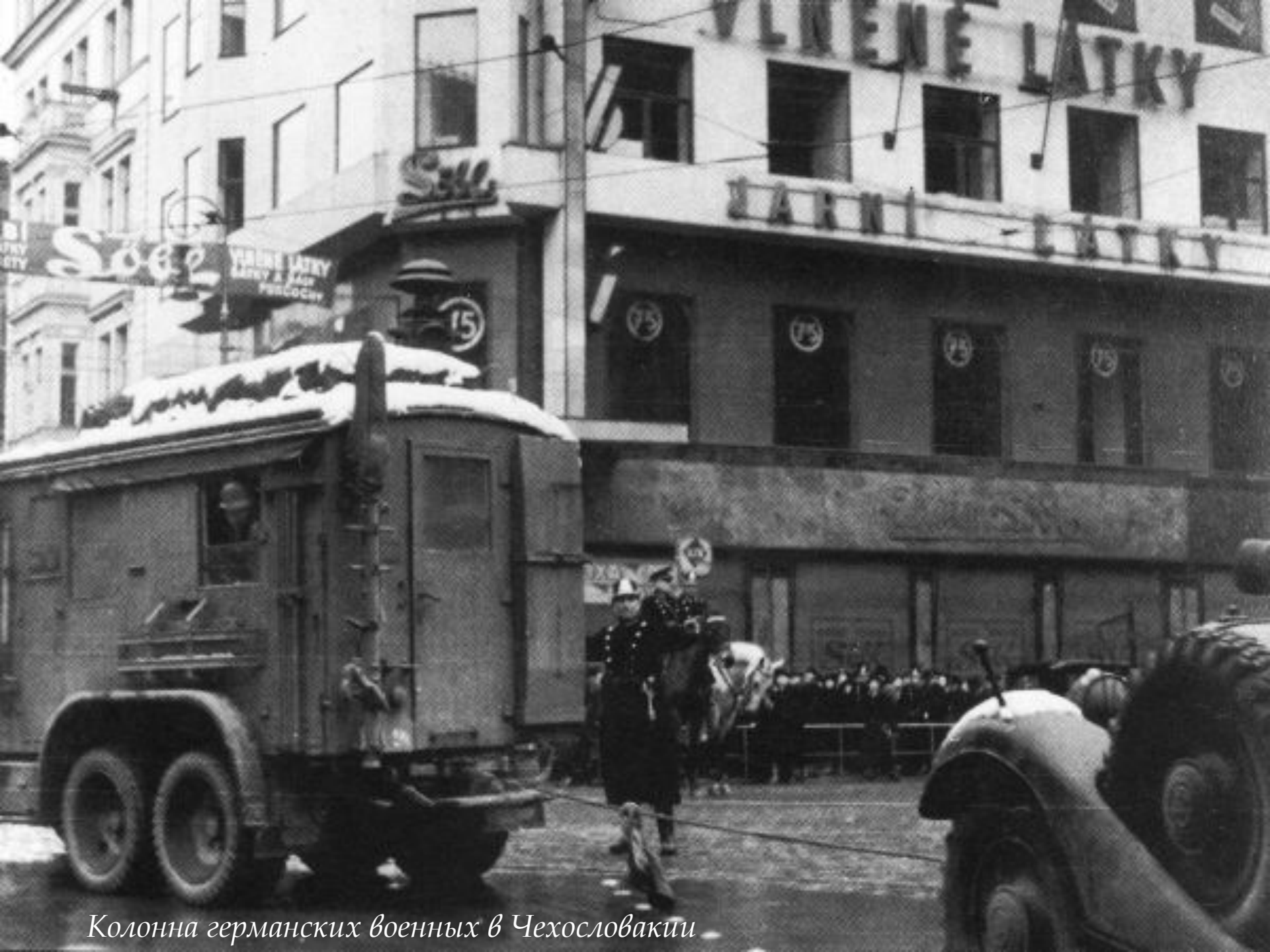
Колонна германских военных в Чехословакии