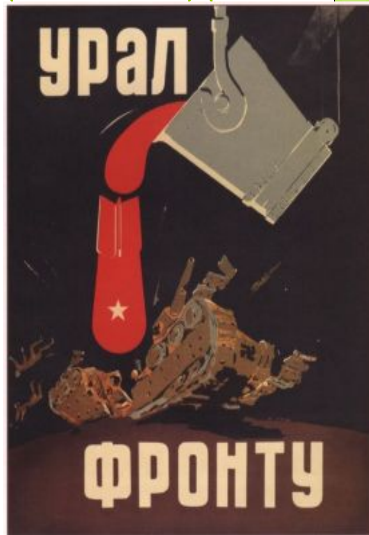
298. Караченцов П. Урал — фронту. 1942

На Урал было эвакуировано большое количество трудовых ресурсов. И хотя эти люди были далеки от линии фронта, для них война тоже стала частью жизни... Эти люди: рабочие уральских заводов, труженики тыла, работники сельского хозяйства, хорошо понимали, что от их работы зависит будущее страны, боеспособность Красной Армии