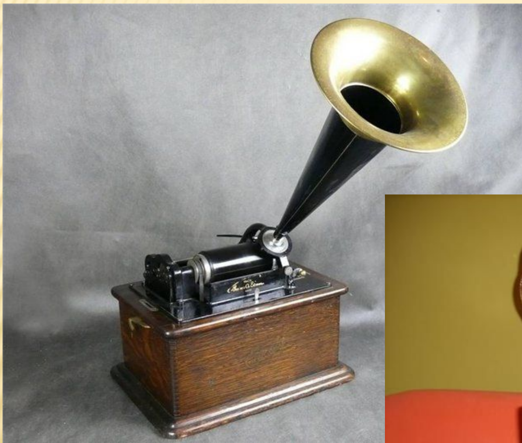
Фонограф Эдисона. 1877 год