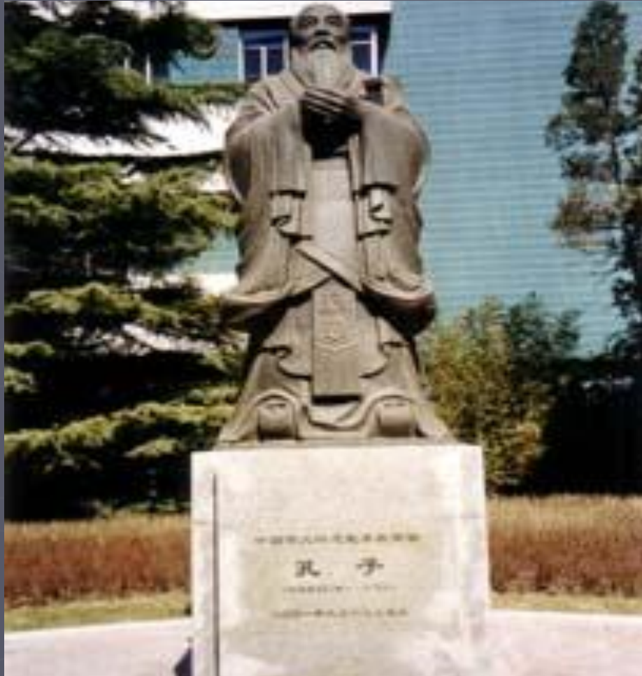
Памятник Конфуцию. Пекинский университет.