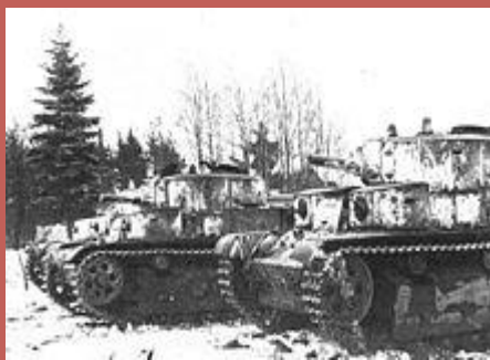
Т-28 на огневом рубеже. Карелия, январь 1940 года