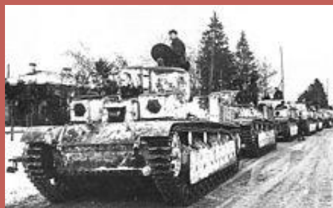
Колонна танков Т-28 из состава 20-й ттбр движется к Карельскому перешейку. Впереди — ледяной ад Зимней войны. Декабрь 1939 года