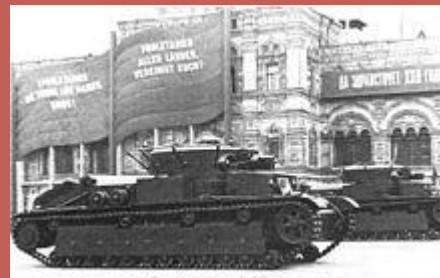
Танки Т-28 образца 1936 года проходят в составе парада по Красной площади. Москва, 7 ноября 1939 года