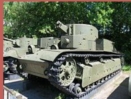
Т-28 в экспозиции Центрального музея Вооружённых Сил в Москве